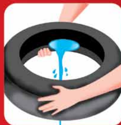
Descarte os pneus velhos ou guarde-os em local coberto e abrigados da chuva.