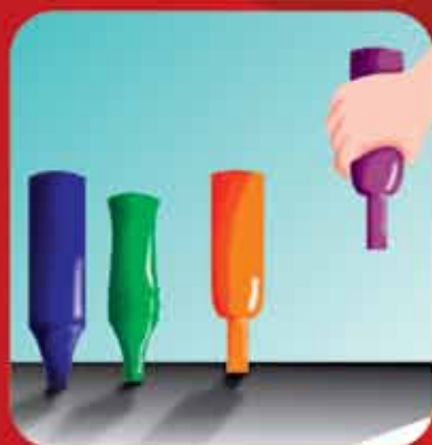
Guarde as garrafas sempre de cabeça para baixo.