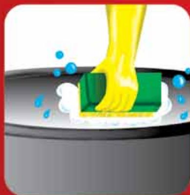
Lave com sabão os recipientes utilizados para armazenar água.