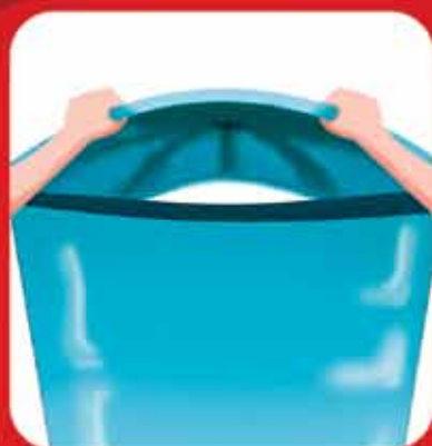
Mantenha todos os recipientes com água adequadamente fechados.