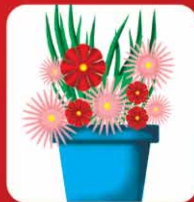
Retire os pratos dos vasos das plantas.

Elimine os criadouros do mosquito da dengue.