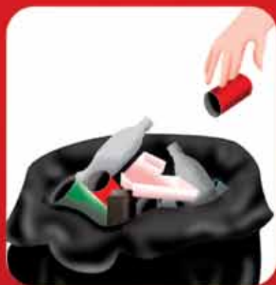
Armazene o lixo em sacos plásticos e mantenha a lixeira tampada.