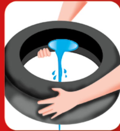
Descarte os pneus velhos ou guarde-os em local coberto e abrigados da chuva.