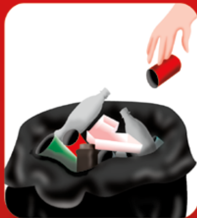
Armazene o lixo em sacos plásticos e mantenha a lixeira tampada.