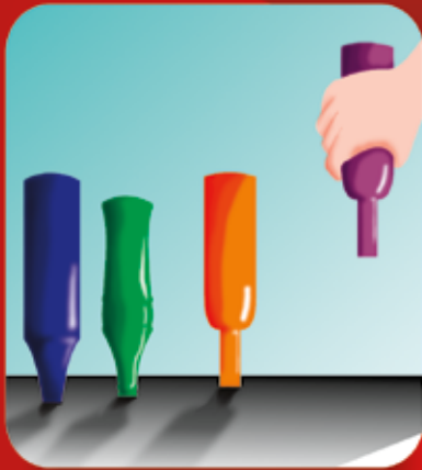
Guarde as garrafas sempre de cabeça para baixo.