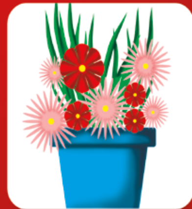
Retire os pratos dos vasos das plantas.

Elimine os criadouros do mosquito da dengue.