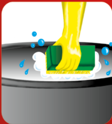
Lave com sabão os recipientes utilizados para armazenar água.