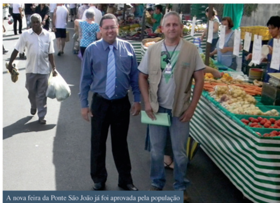
A nova feira da Ponte São João já foi aprovada pela população

O diretor aproveitou também para conversar com os feirantes sobre as inovações que se pretende implantar nas feiras, com base nas reuniões realizadas no final do ano passado, quando algumas sugestões foram apresentadas. “Estivemos reunidos com os feirantes durante algumas semanas e pas-