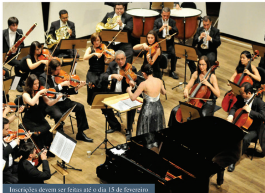
Inscrições devem ser feitas até o dia 15 de fevereiro

Cada programa será composto por quatro ensaios e um concerto, totalizando cinco serviços (cada ensaio será considerado um serviço. A duração de cada serviço é variável, de acordo com sua natureza. Ensaios terão duração máxi-