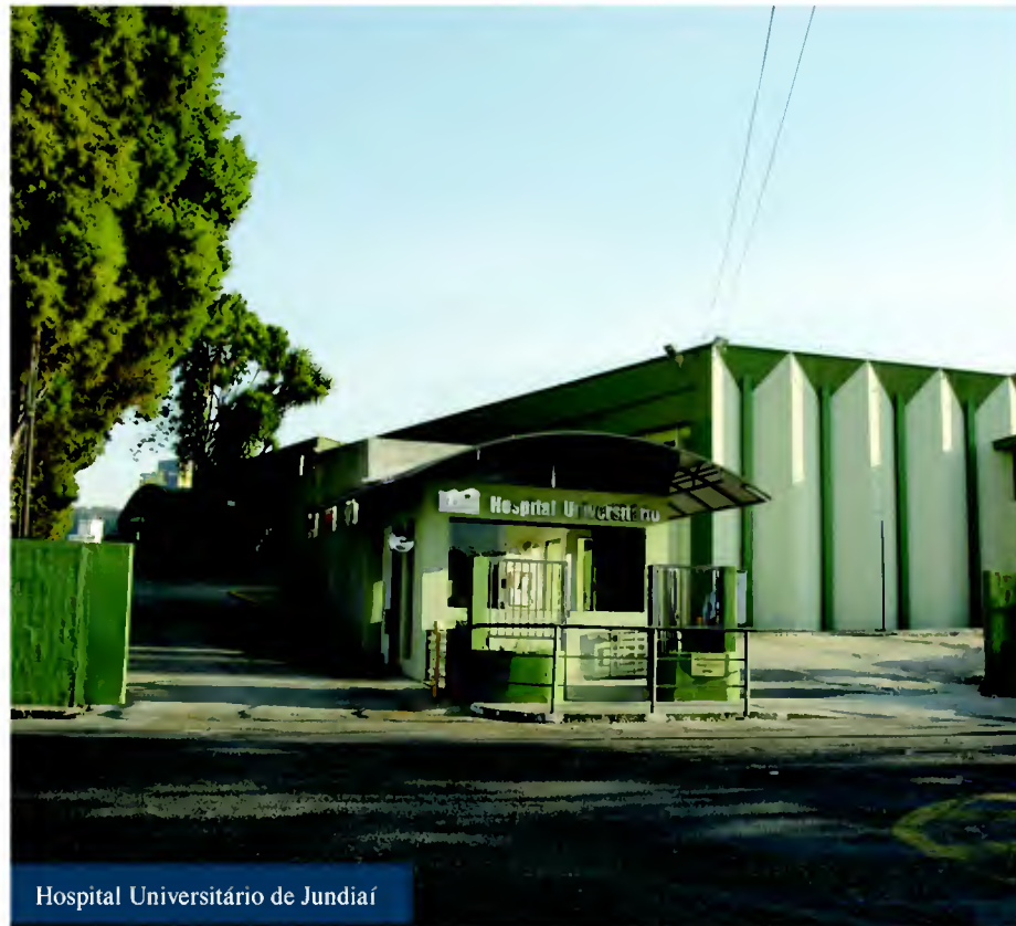
Hospital Universitário de Jundiá

O Centro de Referência em Saúde da Mulher vai atender mulheres encaminhadas por Jundiá e outras oito cidades que compõem o Colegiado Gestor Regional do Departamento Regional de Saúde