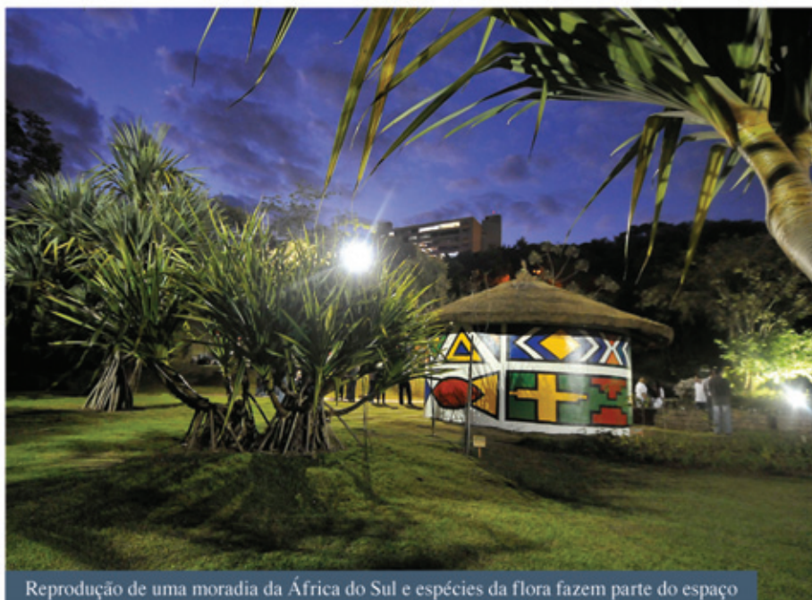
Reprodução de uma moradia da África do Sul e espécies da flora fazem parte do espaço

Depois de quase três meses de trabalho, a Prefeitura de Jundiá entregou o Espaço Africano, na sexta-feira (29), desenvolvido a partir de um projeto apresentado por representantes do movimento negro de Jundiá em abril deste ano. A estrutura com, aproximadamente, 1.400 metros quadrados, de responsabilidade da Secretaria de Serviços Públicos, pode ser visitada no Jardim Botânico de Jundiá. Durante a solenidade de inauguração, os visitantes acompanharam a apresentação de capoeira, do monólogo “Navio Negreiro”, de estudantes da Guiné Bissau e do