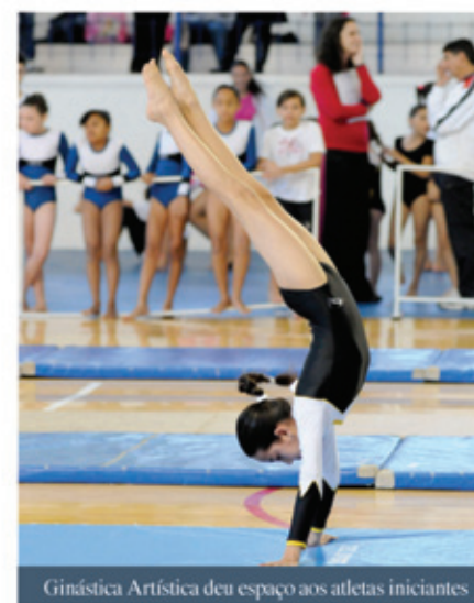
Ginástica Artística deu espaço aos atletas iniciantes

Hoje, a modalidade de Ginástica Artística é oferecida em 13 Complexos Esportivos da cidade de Jundiaí.