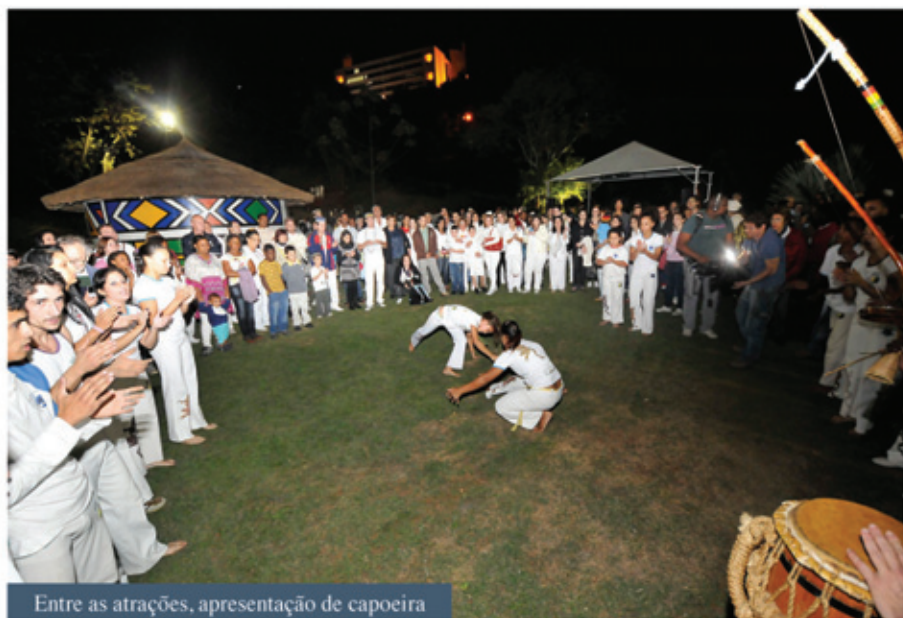
Entre as atrações, apresentação de capoeira

sui uma característica histórica de jardins, diferentemente do que foi constatado à época de desenvolver o Jardim Italiano, por exemplo, inaugurado em março de 2012. O nome ‘Espaço Africano’ foi escolhido na tentativa de retratar as diversas etnias e culturas que coexistem num mesmo continente. Baobá, árvore sagrada para o continente africano, é uma das plantas que está contemplada no projeto paisagístico do Espaço Africano que foi desenvolvido próximo à água, cuja simbologia remete à vida e aos quatro elementos da natureza. Além dos Baobás, os visitantes poderão encontrar Agapanto, Árvore-de-salsicha, Ave-do-Paraíso, Bismarkia, Bulbine, Cabeleira-de-velho, Chapéu-de-sol, Coroa-de-Cristo, Dendê, Espada-de-São-Jorge, Espatódea, Flamboiã, Lança-de-São-Jorge, Mogno-Africano, Moreia-bicolor, Mussaenda-vermelha, Pandanus e Pentas.