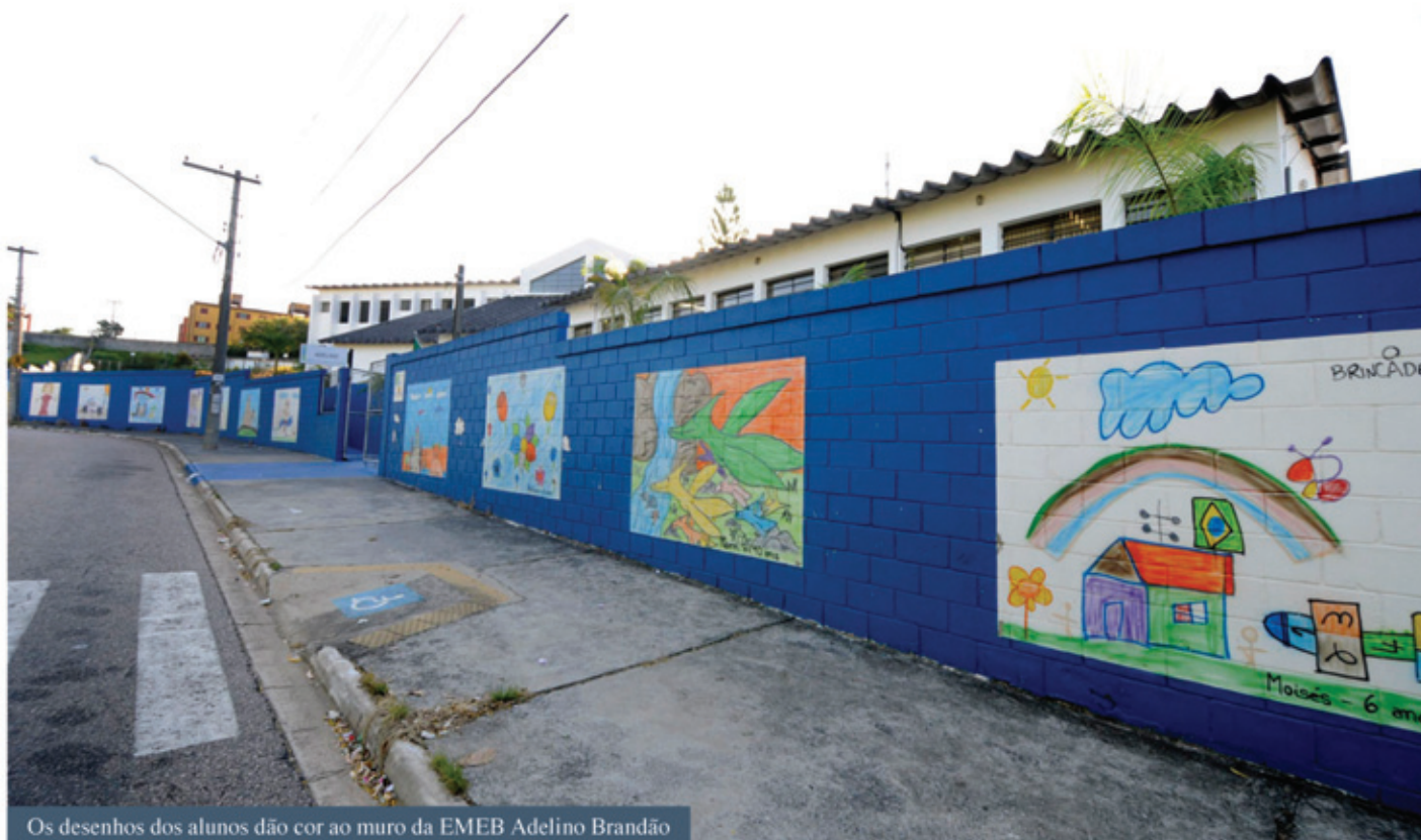
Os desenhos dos alunos dão cor ao muro da EMEB Adelino Brandão

Mesmo à distância é possível saber que dentro de um determinado prédio há crianças com muita disposição para aprender. Isso porque a pergunta "O que queremos mostrar para quem está lá fora?" foi respondida pelos alunos da rede municipal de ensino por meio de desenhos, que, agora, estão nos muros das unidades escolares, após reprodução feita com a técnica de grafite e aerografia.