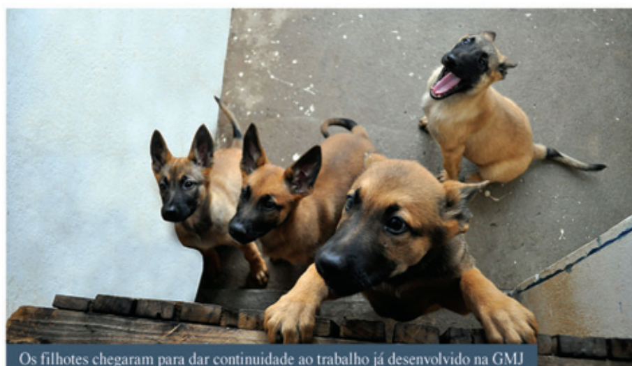
Os filhotes chegaram para dar continuidade ao trabalho já desenvolvido na GMJ