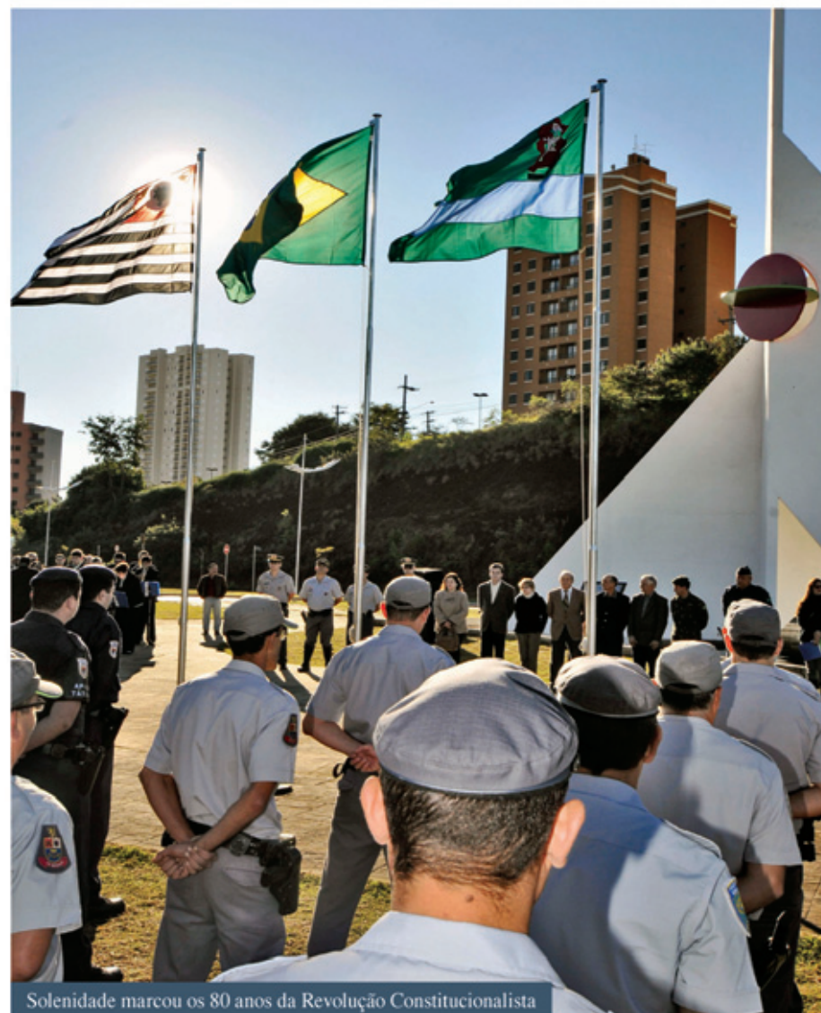
Solenidade marcou os 80 anos da Revolução Constitucionalista

A Revolução Constitucionalista, também conhecida na História do Brasil como "Revolução 32", foi um dos movimentos cívicos mais notáveis da história. A revolução irrompeu no dia 9 de julho de 1932.