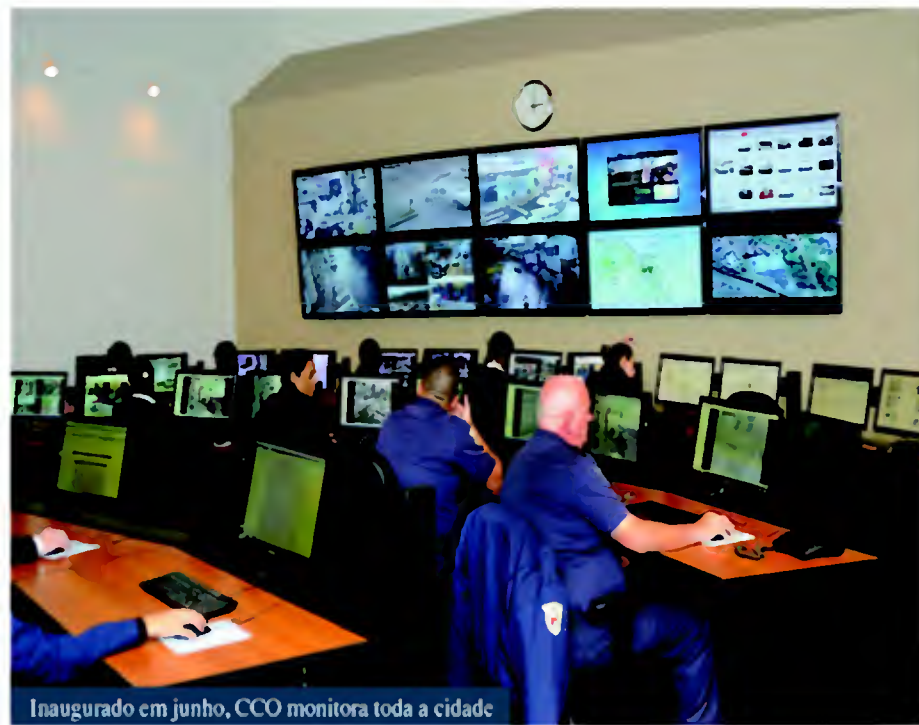
Inaugurado em junho, CCO monitora toda a cidade

O Complexo Fepasa abriga a sede administrativa, operacional, Canil e o Centro de Operações Táticas (COT) – Central de Monitoramento Eletrônico de Câmeras (Olho Vivo), setores que integram o Centro de Controle Operacional (CCO).