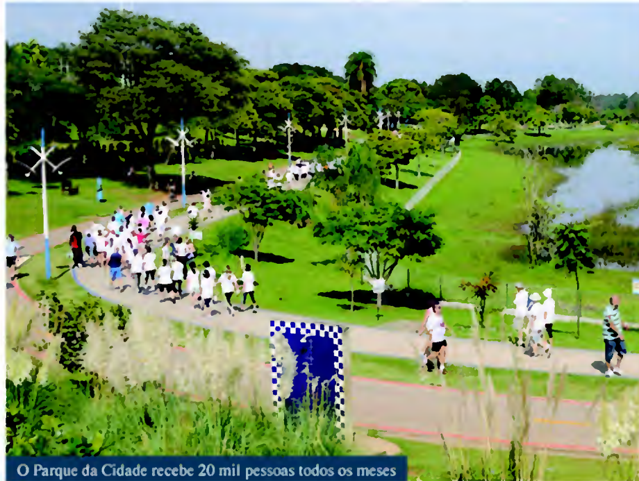
O Parque da Cidade recebe 20 mil pessoas todos os meses

Dentre tantos que chegam e que vão, muitos têm como destino outros espaços públicos que, igualmente, registram uma frequência de público que chama a atenção. Caso do Bolão, por