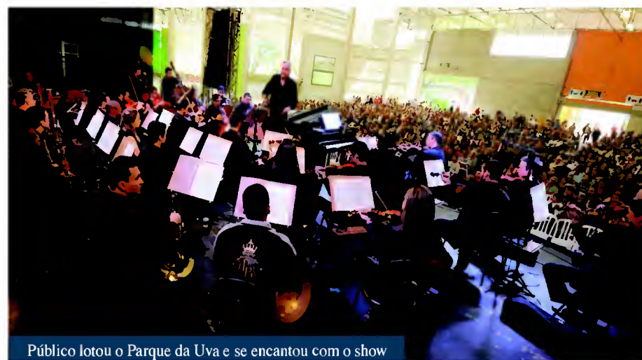
Público lotou o Parque da Uva e se encantou com o show

O renomado maestro esteve em Jundiaí em julho do ano passado. Na ocasião, ele acompanhou o lançamento do “Projeto Batuta”, que é desenvolvido pelo Fundo Social de Solidariedade de Jundiaí, desde maio de 2011. A iniciativa oferece às crianças de baixa renda, de 7 a 11 anos, uma formação completa para orquestra.