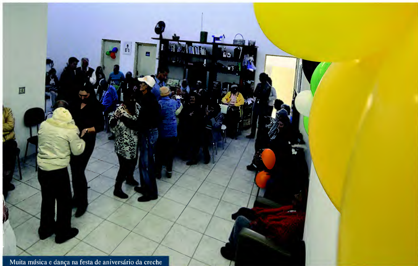
Muita música e dança na festa de aniversário da creche

é meu momento de descanso, onde posso me exercitar, aprender coisas novas e ter muitos amigos. Aqui sei que sempre vou ter companhia”.