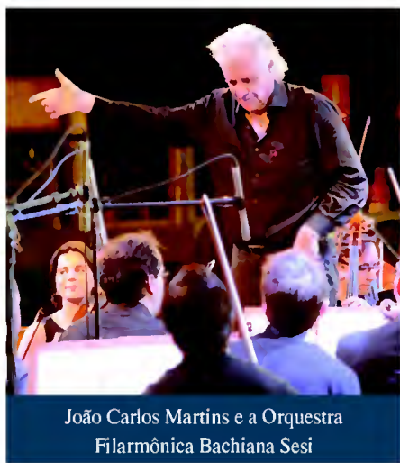
João Carlos Martins e a Orquestra Filarmônica Bachiana Sesi