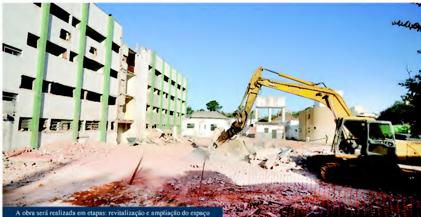
A obra será realizada em etapas: revitalização e ampliação do espaço

O Hospital Regional de Jundiaí será referência para uma população de aproximadamente 813 mil habitantes de oito municípios da região: Jundiaí, Cabreúva, Campo Limpo Paulista, Itatiba, Itupeva, Jarinu, Louveira, Morungaba e Várzea Paulista. A estrutura do novo hospital terá ca-