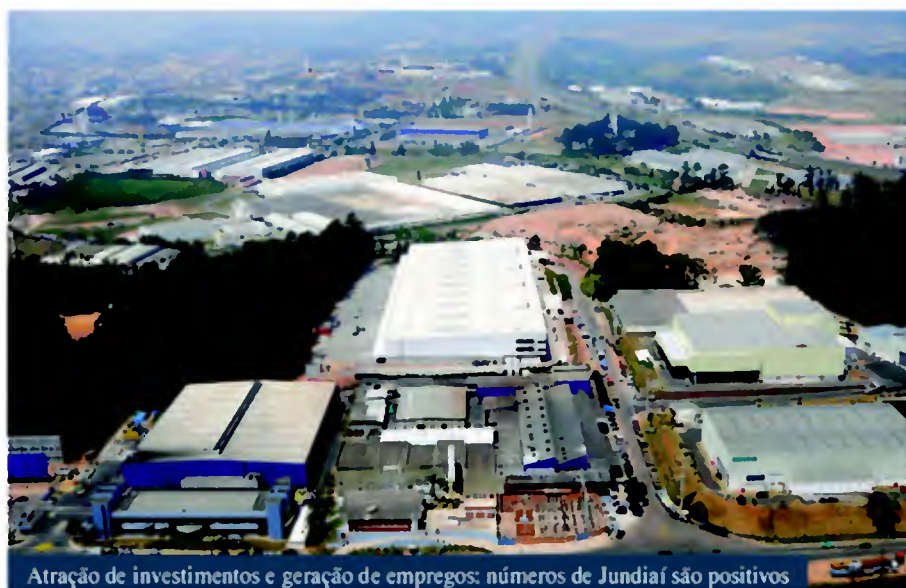
Atração de investimentos e geração de empregos: números de Jundiaí são positivos

Das 1.111 novas vagas abertas em Jundiaí, o Comércio foi o setor que mais empregou com 386 novos empregos gerados, seguido