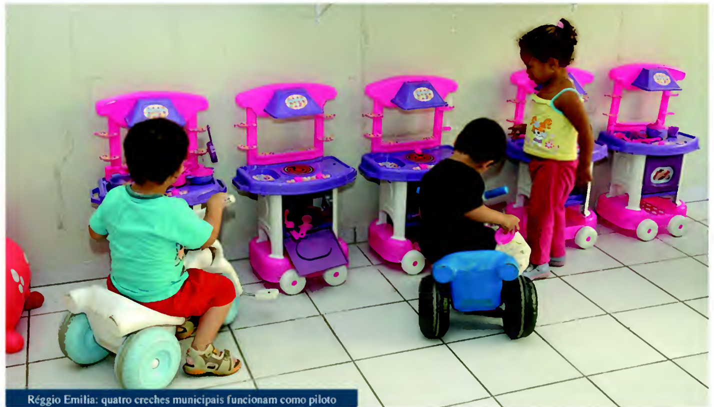
Reggio Emilia: quatro creches municipais funcionam como piloto

Os contatos entre as educadoras de Jundiaí e Reggio Emília foram iniciados em 2010, paralelamente à formulação do projeto de política pública de atendimento das crianças de zero a três anos estruturado pela Secretaria de Educação para Jundiaí. Desde então, houve troca de informações