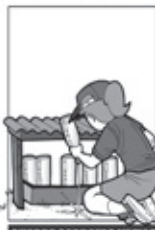
GUARDE GARRAFAS VAZIAS DE BOCA PARA BAIXO