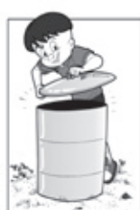
MANTENHA O LIXO TAMPADO