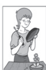
FURE OS PRATOS DOS VASOS DE PLANTAS