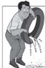
GUARDE OS PNEUS EM LOCAIS SECOS