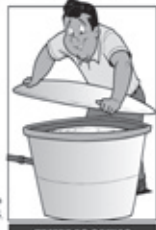
TAMPE AS CAIXAS D'ÁGUA