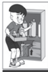
ARMAZENE ADEQUADAMENTE OS MATERIAIS RECICLÁVEIS