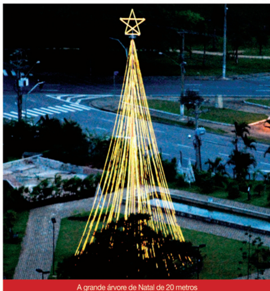
A grande árvore de Natal de 20 metros

16h30 – Papai Noel na Casinha 17h – Canil – Guarda Municipal 19h – Trupe Koskowisck – Teatro Pinheiro de Natal 20h – Tio Pan Eventos – Auto de Natal 21h – Banda Brasil In Concerto – Entrega dos Brinquedos.