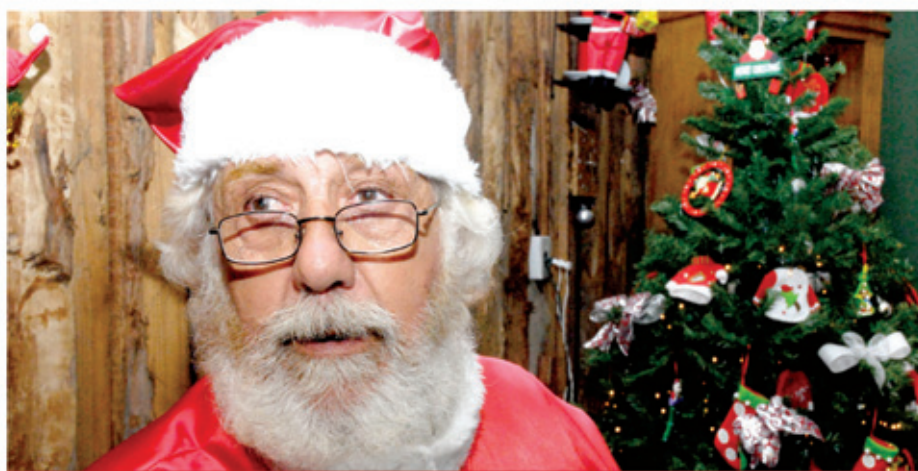
Papai Noel é um dos destaques da festa do Botânico

O Natal e o Ano Novo caem em uma sexta-feira. No sábado, o funcionamento das feiras será normal, nos seguintes locais: Parque Eloy Chaves, na Rua Hugo Milani, e Vianelo, na Marginal direita do Rio Guapeva. No Jardim das Tulipas, desde a semana passada, os moradores contam com um novo varejão, que tem suas bancas montadas na Rua Henrique Vasques, entre as ruas Adelino Martins e João Manzan.