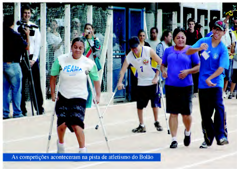
As competições aconteceram na pista de atletismo do Bolão