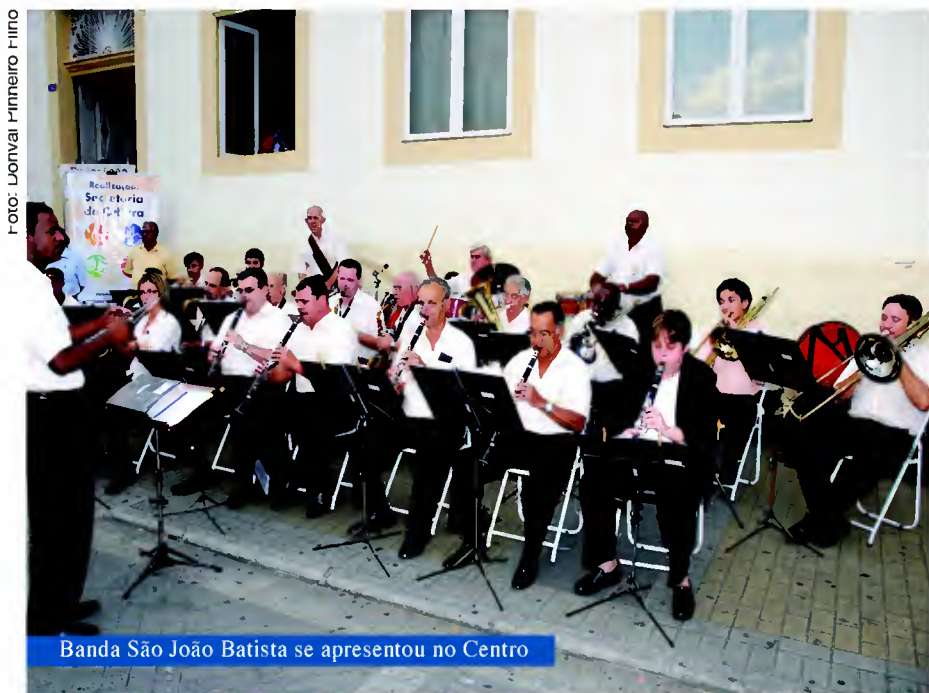
Banda São João Batista se apresentou no Centro

As apresentações contam com duração de 60 a 90 minutos. O programa tem continuidade e nesta sexta-feira, 07 de maio, a Banda São João Batista volta a ser a atração da “Música no Centro”, dessa vez promovendo uma homenagem especial às mães.