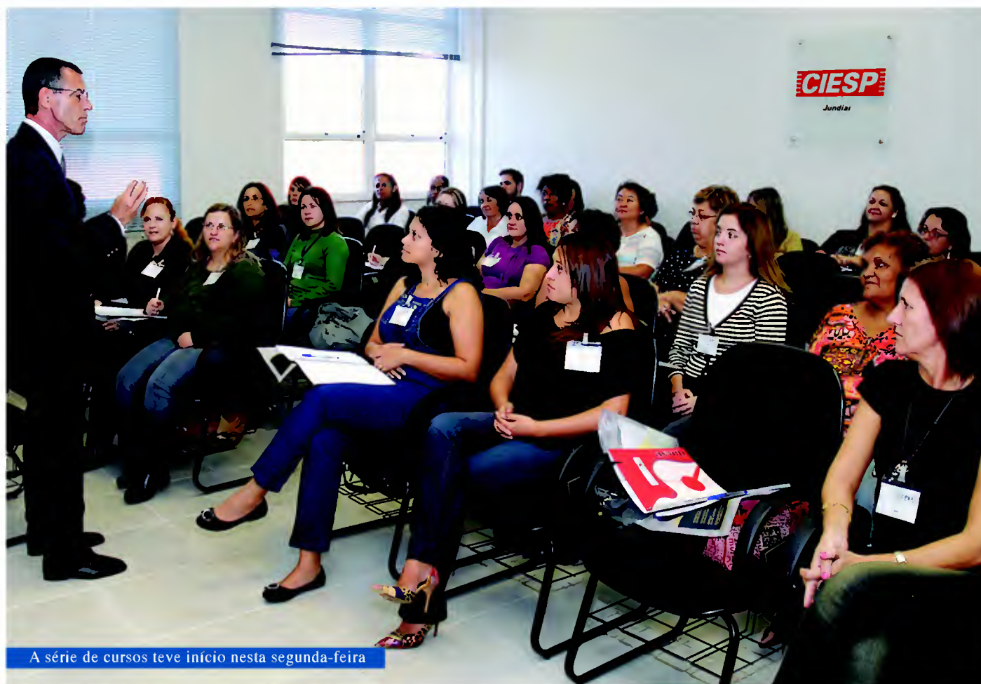
A série de cursos teve início nesta segunda-feira