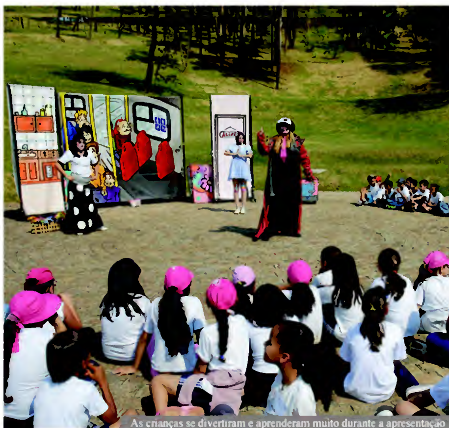
As crianças se divertiram e aprenderam muito durante a apresentação