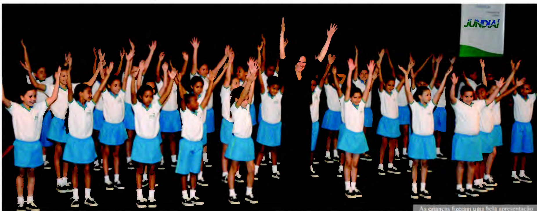
As crianças fizeram uma bela apresentação