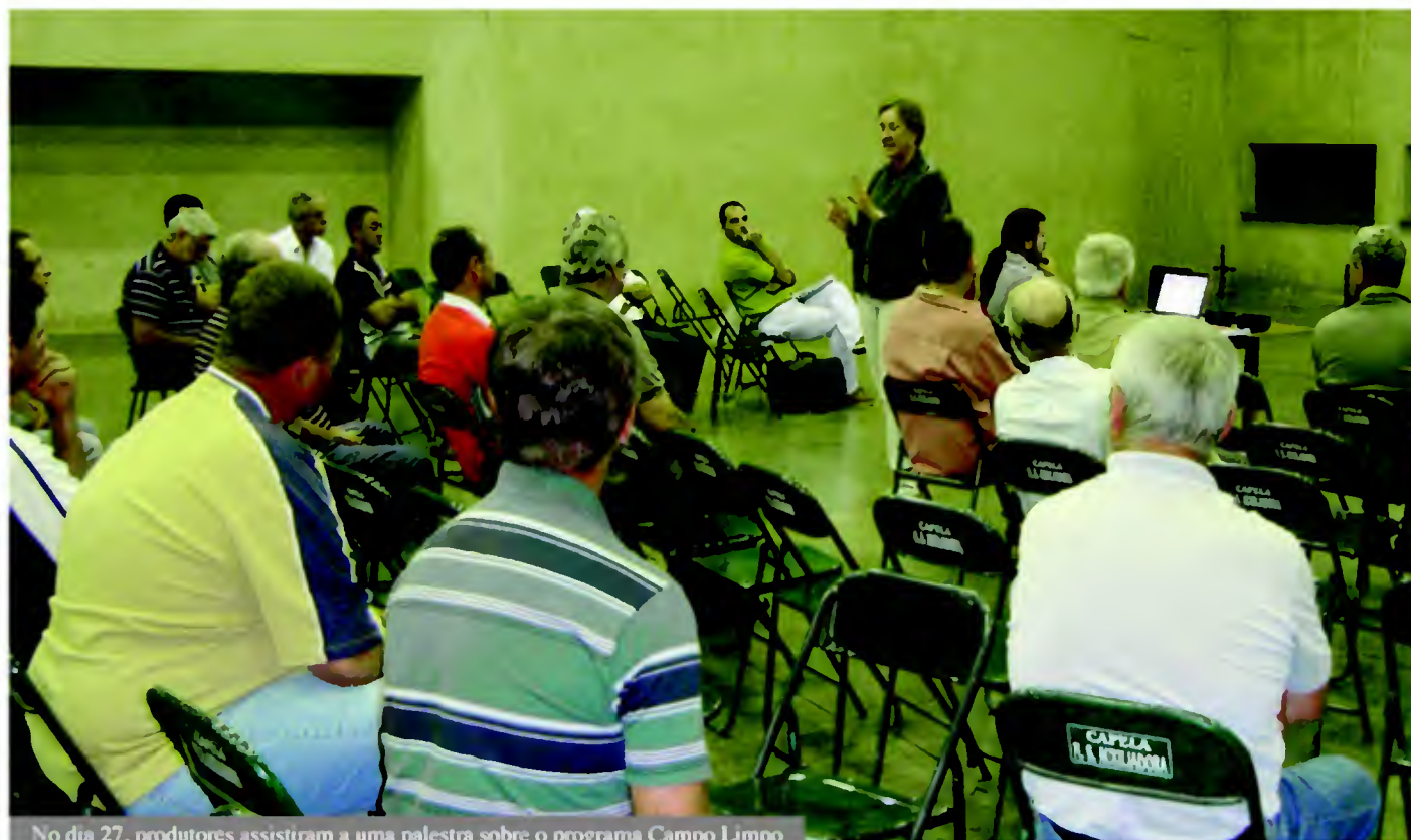
No dia 27, produtores assistiram a uma palestra sobre o programa Campo Limpo