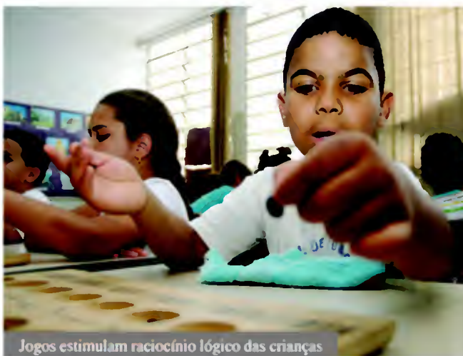
Jogos estimulam raciocínio lógico das crianças

ximo teremos nossas crianças muito mais concentradas e com um nível de proficiência bastante elevado em matemática". Para tanto, a Secretaria de Educação desenvolveu um trabalho de formação direcionado aos profissionais da rede municipal de