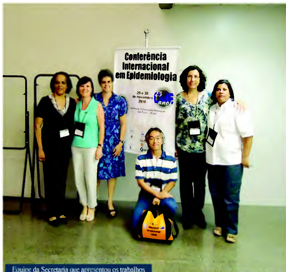
Equipe da Secretaria que apresentou os trabalhos

Três trabalhos científicos produzidos por equipes da Secretaria Municipal de Saúde foram selecionados e apresentados durante a Conferência Internacional em Epidemiologia, realizada, no final de novembro, pelo Governo do Estado de São Paulo, em comemoração aos 25 anos do Centro de Vigilância Epidemiológica da Secretaria de Estado da Saúde.