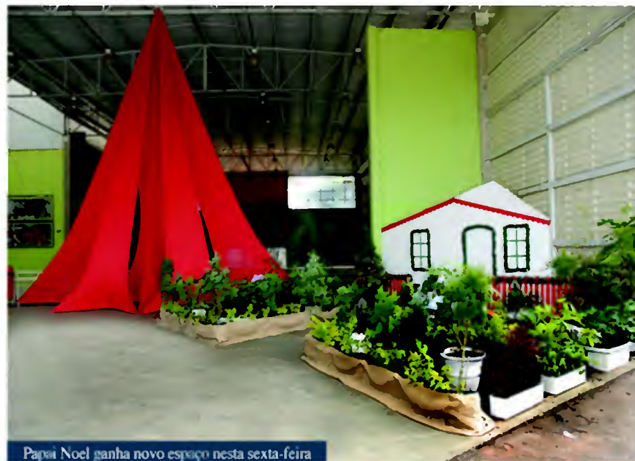
Papai Noel ganha novo espaço nesta sexta-feira

"A chegada ao Parque da Uva é menos tumultuada; há lugar para estacionar com tranquilidade, já que o parque fica longe do Centro comercial e dos shoppings, que nesta época do ano têm sua movimentação elevada. Além disso, neste espaço, poderemos abrigar maior número de atrações, stands e até mesmo gran-