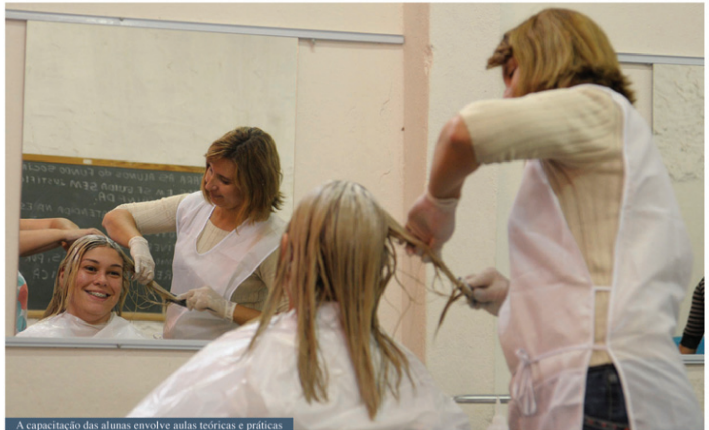
A capacitação das alunas envolve aulas teóricas e práticas

O crescimento da cidade e a vinda de novas empresas têm aquecido o mercado de trabalho. Para a atual administração, a geração