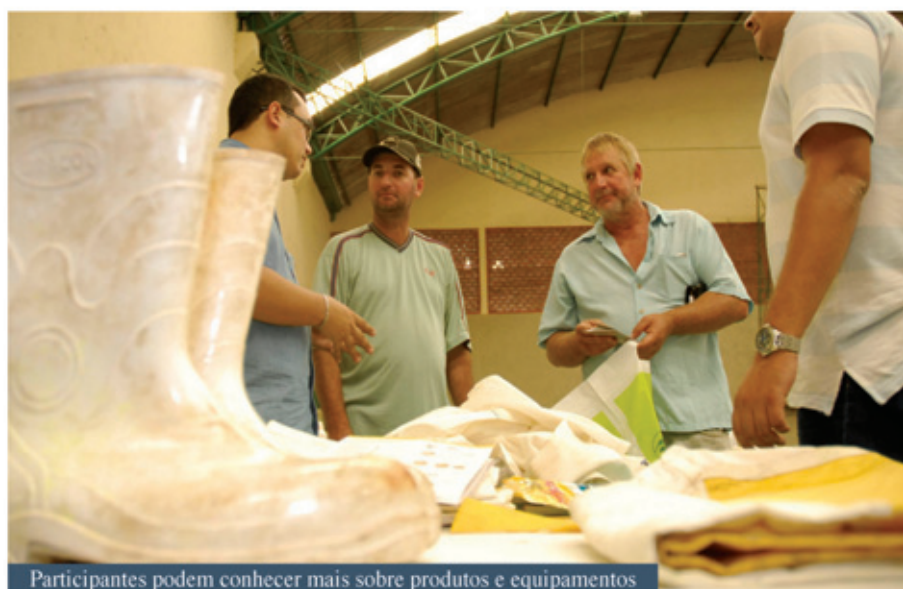
Participantes podem conhecer mais sobre produtos e equipamentos

de levar às regiões de cultivo da cidade ações voltadas à prevenção, além de orientações sobre práticas corretas no uso de defensivos agrícolas e equipamentos de proteção individual. A intenção da secretaria é identificar possíveis casos de doenças causadas pela exposição a produtos agrotóxicos e, quando constatado, fazer o encaminhamento necessário para tratar o problema primariamente. Na primeira edição, das 30 pessoas atendidas durante o programa, foram constatadas apenas duas anormalidades, sendo os trabalhadores encaminhados para atendimento específico na Unicamp e monitorados pelo Centro de Referência em Saúde do Trabalhador (Cerest).