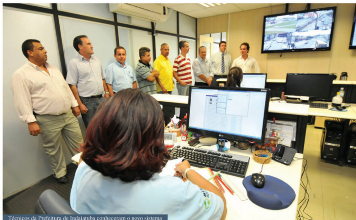
Técnicos da Prefeitura de Indaiatuba conheceram o novo sistema

Com a ajuda do GPS foi possível detectar algumas necessidades dos usuários, que já estão sendo atendidas como mais ônibus aos