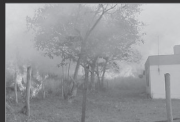
Incêndio em zona rural causa: BALÃO