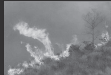
Fogo na Serra do Japi causa: BALÃO