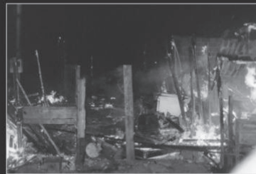
Incêndio em residência causa: BALÃO

Resolução SMA 37/2005 - Art. 46 - multa de R$ 5.000,00 ou 375,94 UFESPs por unidade.