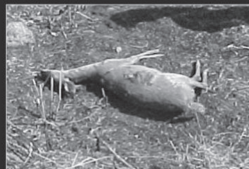
Animal silvestre morto em incêndio causa: BALÃO