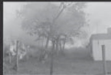
Incêndio em zona rural causa: BALÃO