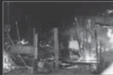
Incêndio em residência causa: BALÃO

Resolução SMA 37/2005 - Art. 46 - multa de R$ 5.000,00 ou 375,94 UFESPs por unidade.