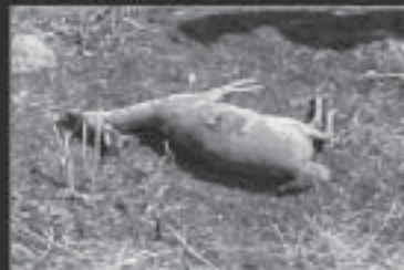
Animal silvestre morto em incêndio causa: BALÃO