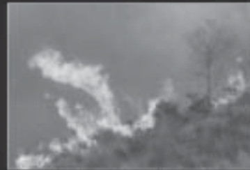
Fogo na Serra do Japi causa: BALÃO