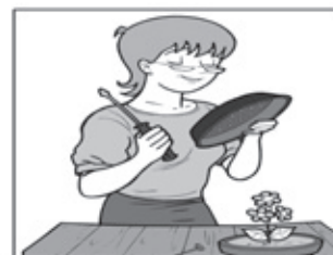
FURE OS PRATOS DOS VASOS DE PLANTAS