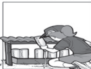
GUARDE GARRAFAS VAZIAS DE BOCA PARA BAIXO