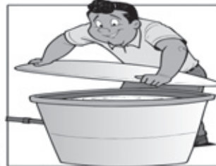
TAMPE AS CAIXAS D'ÁGUA