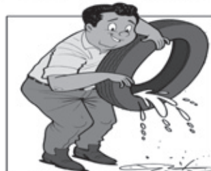
GUARDE OS PNEUS EM LOCAIS SECOS