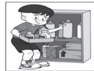
ARMAZENE ADEQUADAMENTE OS MATERIAIS RECICLÁVEIS