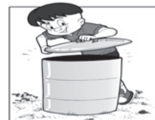
MANTENHA O LIXO TAMPADO