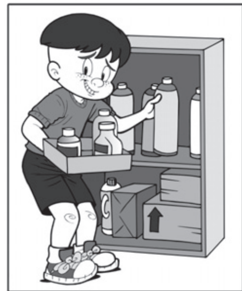
ARMAZENE ADEQUADAMENTE OS MATERIAIS RECICLÁVEIS