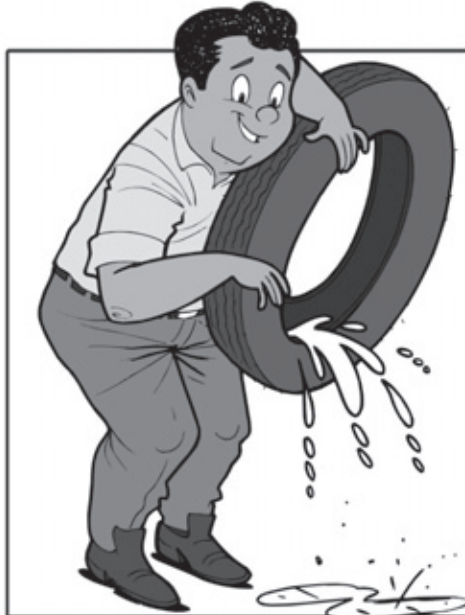
GUARDE OS PNEUS EM LOCAIS SECOS