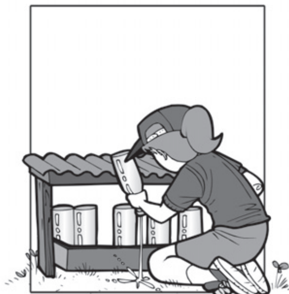
GUARDE GARRAFAS VAZIAS DE BOCA PARA BAIXO