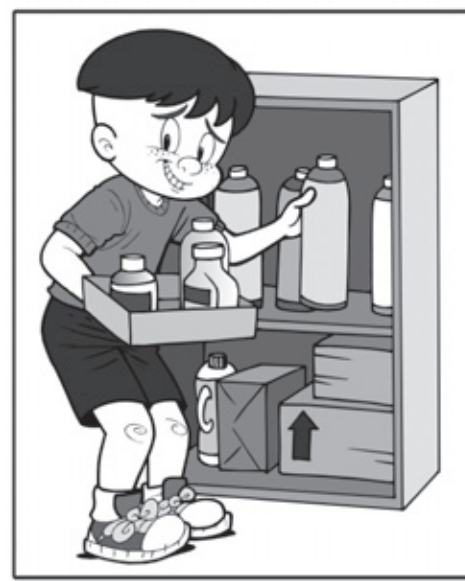
ARMAZENE ADEQUADAMENTE OS MATERIAIS RECICLÁVEIS