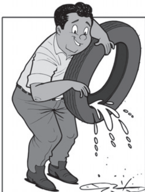
GUARDE OS PNEUS EM LOCAIS SECOS