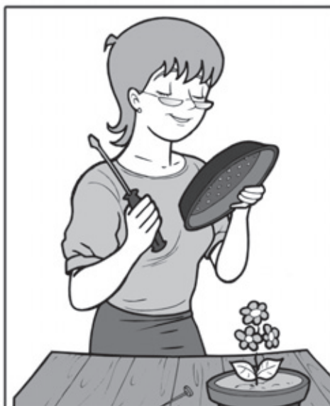
FURE OS PRATOS DOS VASOS DE PLANTAS