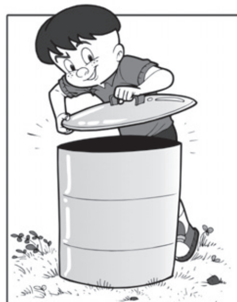
MANTENHA O LIXO TAMPADO