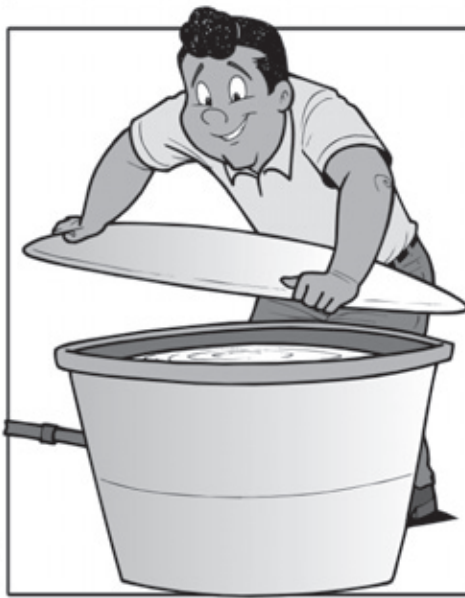
TAMPE AS CAIXAS D'ÁGUA