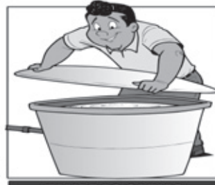
TAMPE AS CAIXAS D'ÁGUA