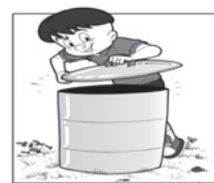
MANTENHA O LIXO TAMPADO