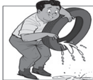
GUARDE OS PNEUS EM LOCAIS SECOS