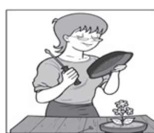
FURE OS PRATOS DOS VASOS DE PLANTAS