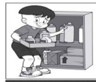
ARMAZENE ADEQUADAMENTE OS MATERIAIS RECICLÁVEIS