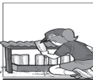
GUARDE GARRAFAS VAZIAS DE BOCA PARA BAIXO