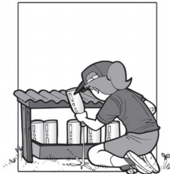
GUARDE GARRAFAS VAZIAS DE BOCA PARA BAIXO