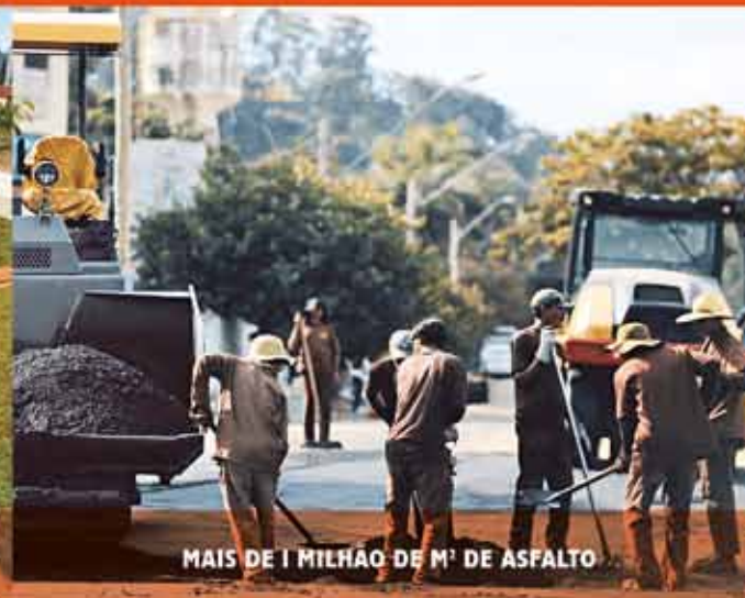
MAIS DE 1 MILHÃO DE M² DE ASFALTO