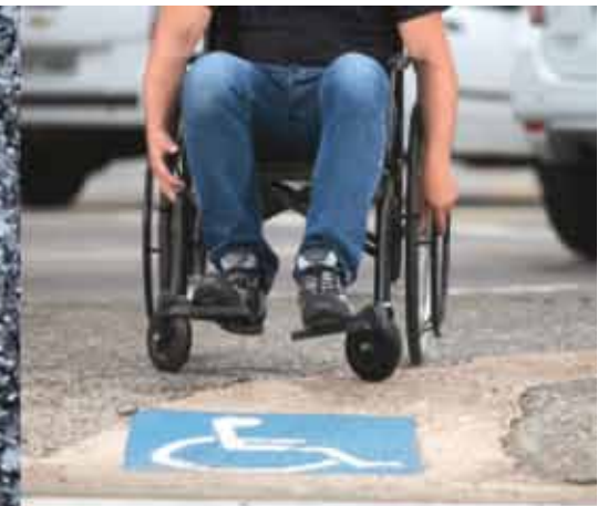
CALÇADAS ACESSÍVEIS POR TODA A CIDADE