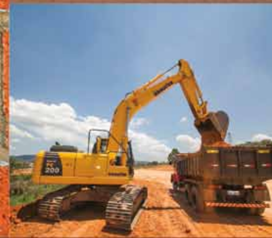
1.088 NOVAS MORADIAS NO JARDIM NOVO HORIZONTE