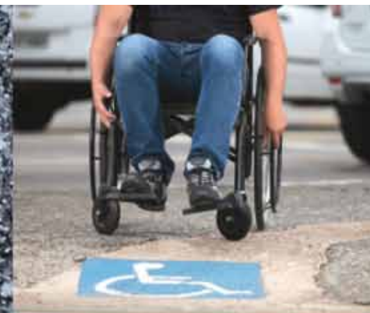
CALÇADAS ACESSÍVEIS POR TODA A CIDADE