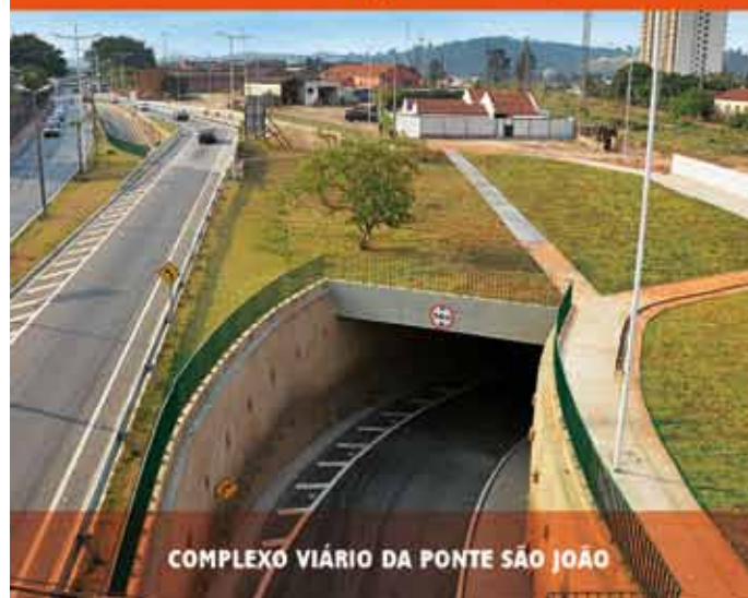
COMPLEXO VIÁRIO DA PONTE SÃO JOÃO

Fique ligado e acompanhe de perto todas as ações da prefeitura para fazer de Jundiaí uma cidade cada dia melhor para viver.