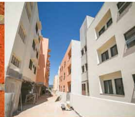
108 NOVAS UNIDADES NA VILA ANA

Fique ligado e acompanhe de perto todas as ações da prefeitura para fazer de Jundiá uma cidade cada dia melhor para viver.