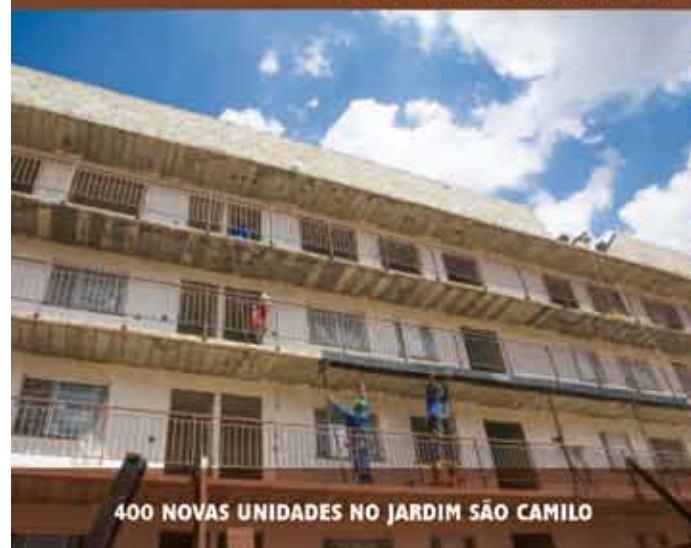
400 NOVAS UNIDADES NO JARDIM SÃO CAMILO