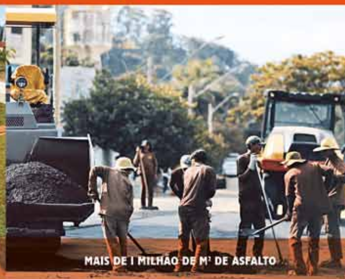
MAIS DE 1 MILHÃO DE M² DE ASFALTO