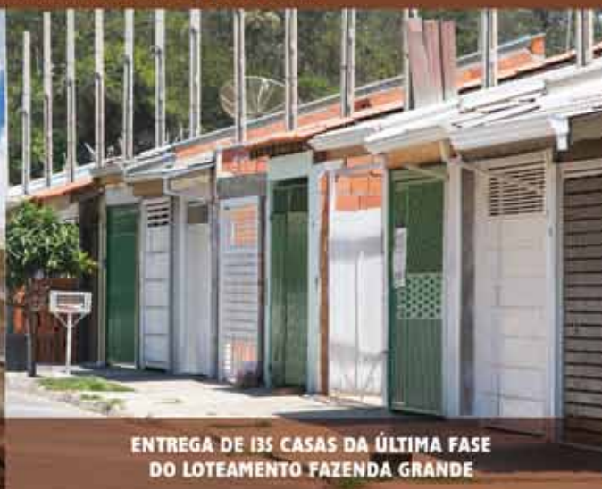
ENTREGA DE 135 CASAS DA ÚLTIMA FASE DO LOTEAMENTO FAZENDA GRANDE