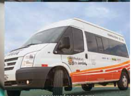
CONSULTÓRIO DE RUA