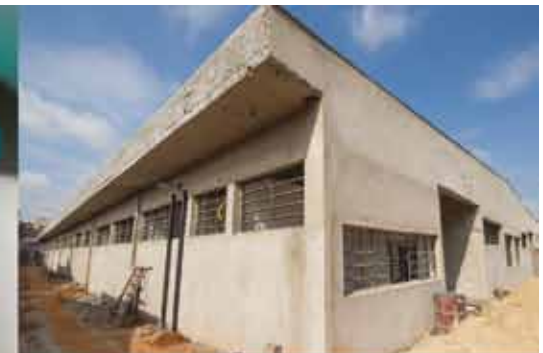
UPA NOVO HORIZONTE EM FASE DE ACABAMENTO