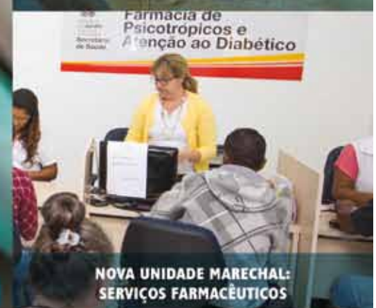
Farmácia de Psicotrópicos e Atenção ao Diabético