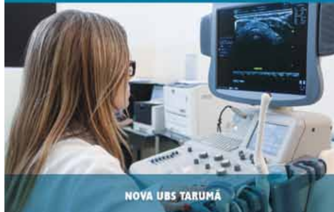
NOVA UBS TARUMA

Fique ligado e acompanhe de perto todas as ações da prefeitura para fazer de Jundiá uma cidade cada dia melhor para viver.