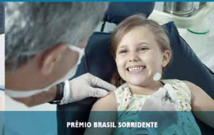
PRÊMIO BRASIL SORRIDENTE