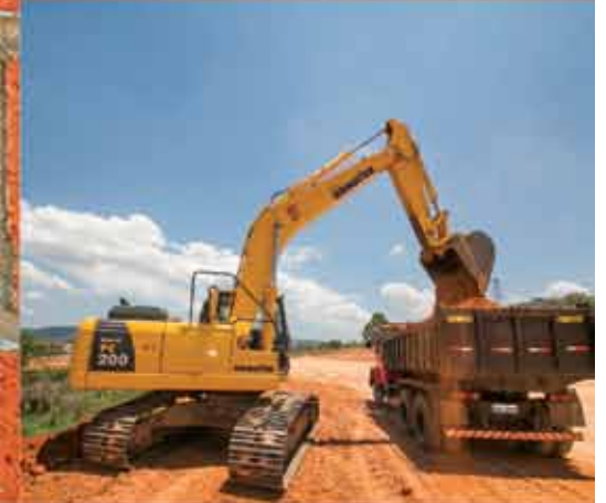
1.088 NOVAS MORADIAS NO JARDIM NOVO HORIZONTE

Fique ligado e acompanhe de perto todas as ações da prefeitura para fazer de Jundiá uma cidade cada dia melhor para viver.