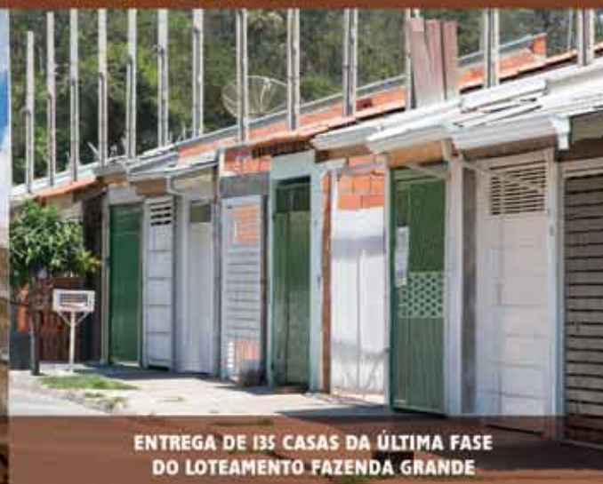
ENTREGA DE 135 CASAS DA ÚLTIMA FASE DO LOTEAMENTO FAZENDA GRANDE