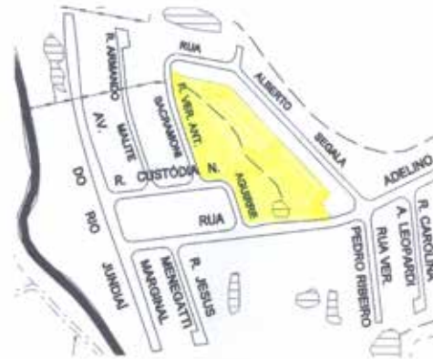
Sistema de Lazer 7 - Jardim Tulipas