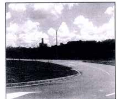
Vista da Av. Projetada "1"

THALES GASSER FORTI Engenheiro SMO/DP/SE