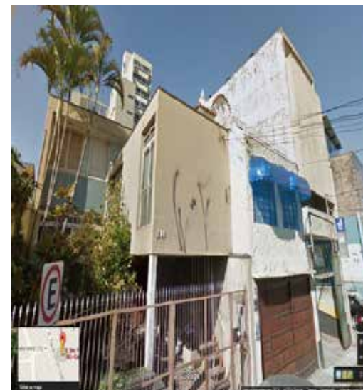
Imóveis vizinhos