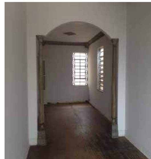
Sala interna – elementos decorativos