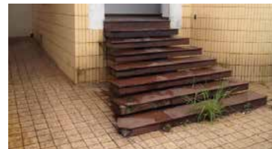
Imóvel à Rua Senador Fonseca, 766 – Fotomontagem.