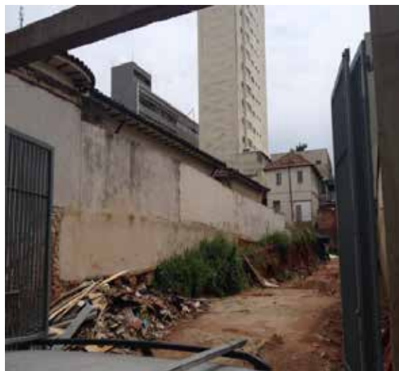
Terreno lateral – acive do terreno onde está construída a casa.