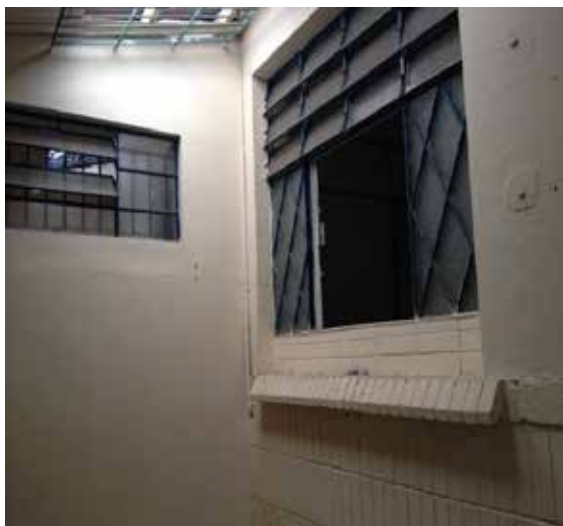
Garagem – vão alterado e mudança de esquadria; parapeito com pingadeira.