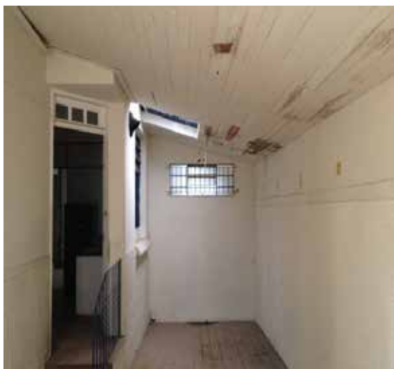
Recuo lateral coberto com prolongamento do telhado da casa.