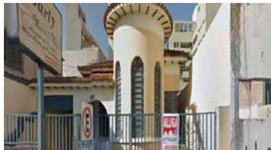
Fachada principal