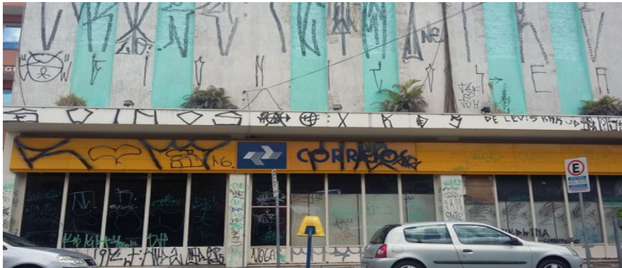
Agência Central dos Correios, à rua Marechal Deodoro da Fonseca, com aspecto horrível causado pela pichação