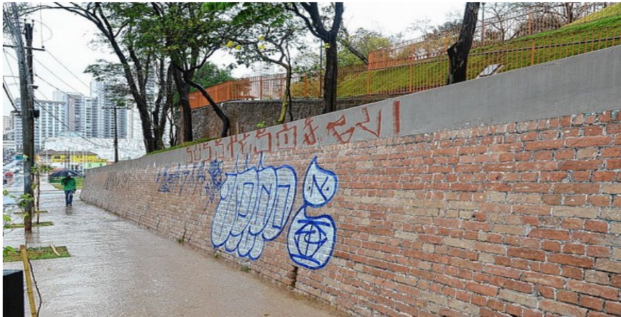
Esplanada Monte Castelo, recentemente inaugurada