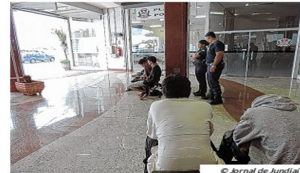
Jovens foram detidos pichando a Pinacoteca

Um grupo de pichadores foi detido na manhã de sábado por guardas municipais depois de serem vistos pichando o muro da Pinacoteca, no Centro de Jundiaí. Segundo informações do Centro de Operações Táticas da GM, os guardas que trabalhavam na Câmara Municipal visualizaram o grupo, formado por oito jovens de Louveira.