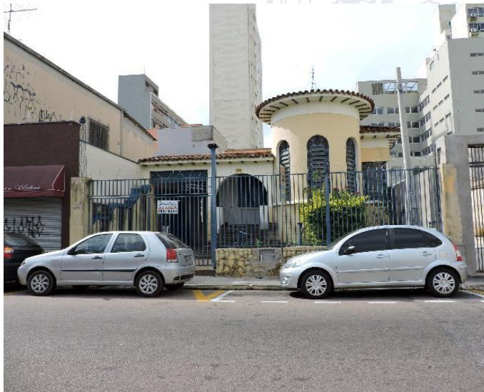
Imóvel da Rua Senador Fonseca – Fonte: DPH, jul/2018

O proprietário solicita autorização para pintura interna, sendo que o piso receberá cor cinza e as paredes, cor bege. Esclarece que, pretende restaurar as fachadas, assim que for concluído o processo de tombamento. Este Departamento solicita a avaliação e deliberação do COMPAC.