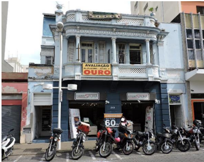
Imóvel da Rua do Rosário

O imóvel está localizado à Rua Senador Fonseca, 766 – Centro e faz Parte do Inventário de Proteção do Patrimônio Artístico e Cultural de Jundiaí (IPPAC) sob grau de proteção 2 (volumetria e fachada)