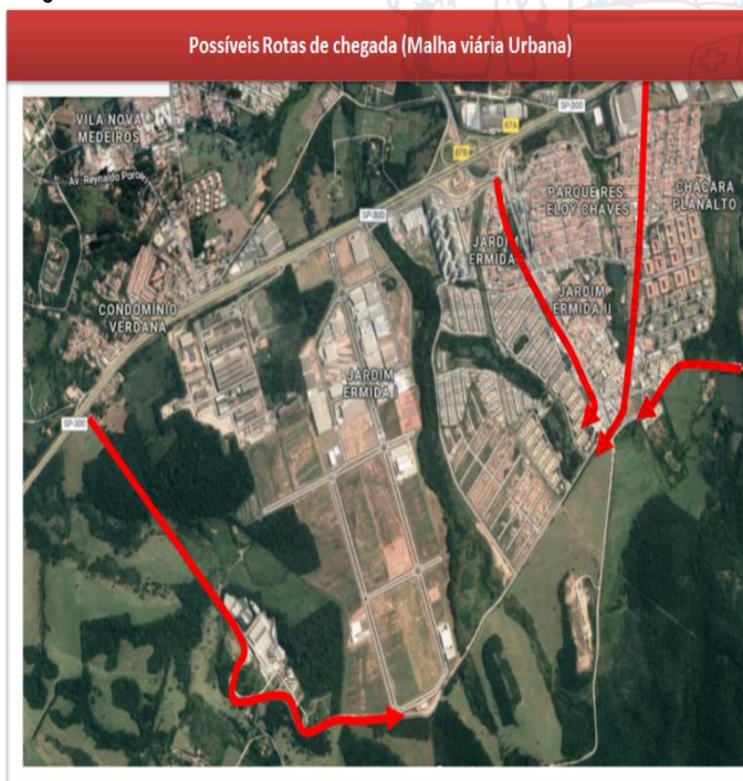
Imagem 4 – Rotas de deslocamento (malha viária urbana) – Lot. Multivias II

De acordo com os cálculos de geração de viagens, que foram baseados nos dados coletados das empresas do mesmo grupo situadas em Diadema-SP, estima-se que o empreendimento irá produzir em média 240 viagens/dias, considerando o deslocamento das populações fixas e flutuantes. Conforme pode-se observar na tabela 01, as vias consideradas para estudo, vias estas situadas no interior do Pólo Logístico, não apresentaram alterações significativas nos níveis de serviços após implantação do empreendimento.