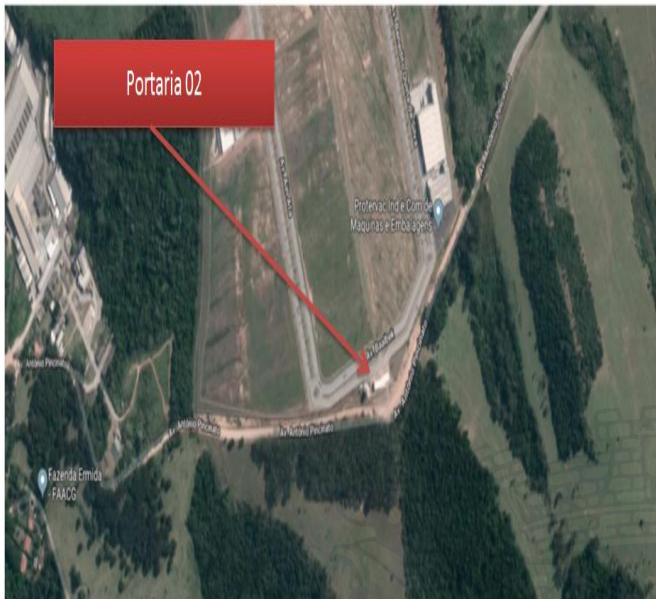
Imagem 3 – Portaria 02 – Lot. Multivias II

apresentação de um estudo específico de demanda, considerando a ocupação total do Pólo Logístico e não somente uma avaliação individual como a apresentada, de forma a dimensionar essas áreas prevendo futuros entraves nas vias de entorno.