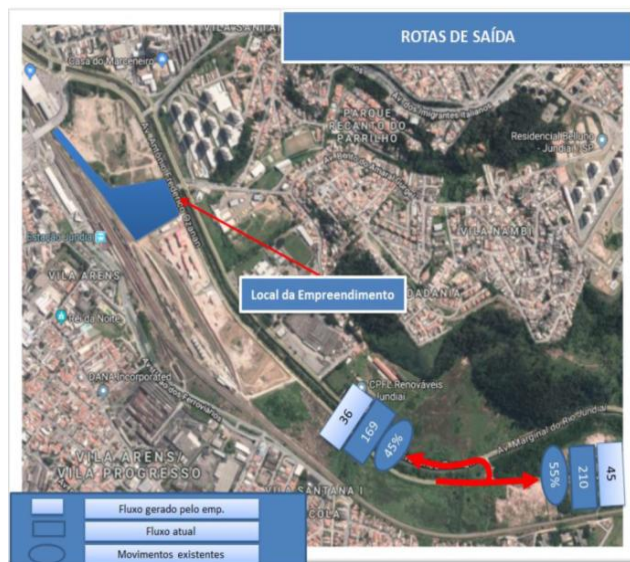
Imagem 04 – Rotas de Saída