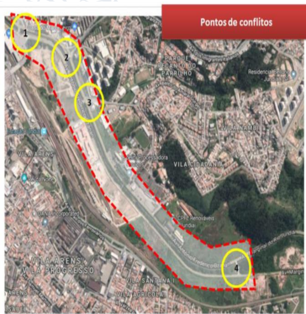
Imagem 05 – Pontos de conflito (AID)

O estudo de capacidade viária realizado neste relatório avaliou os cenários atuais e com a instalação do polo gerador nas aproximações e as intersecções elencadas dentro da área de influência direta (imagem 05).