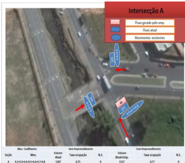
Imagem 06 - Interseção A: Av. Antônio F. Ozanam x Rua Ângelo Corradini