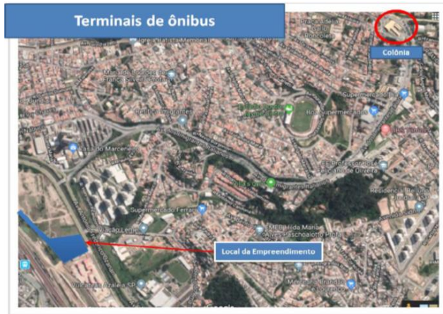
Imagem 11 – Localização do Terminal Colônia