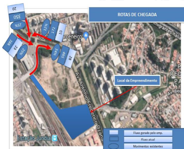
Imagem 03 – Rotas de Chegada