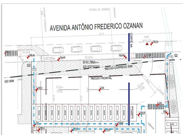
Imagem 02 – Detalhe esquemático de acesso ao Lote 3

a. As operações de carga e descarga, devem obrigatoriamente ocorrer dentro dos limites do lote do empreendimento,