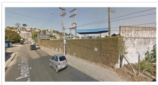
Imagem 12 – Ponto de Parada de ônibus

O ponto está instalado em local que possui calçada, em boas condições, porém não possui abrigo.