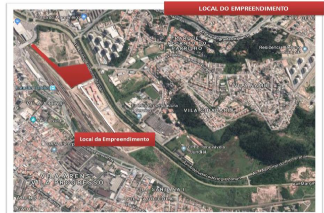
Imagem 01 – Localização do empreendimento

O EMCCAMP RESIDENCIAL S/A, (lote 03), está localizado na Av. Antônio Frederico Ozanam, via estrutural, situada na zona de Desenvolvimento dos Corredores Urbanos – ZDCU, imóvel de matrícula nº 168.764, do 2º ORI de Jundiaí, de propriedade de EMCCAMP INCORPORAÇÃO JUNDIAÍ SPE LTDA.