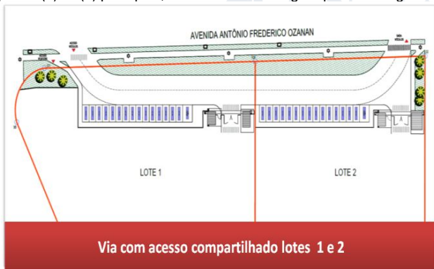
Imagem 01 – detalhe do acesso de saída defronte aos lotes 01 e 02.

3.) Atendimento as indicações de projeto nos acessos visando a diminuição de conflitos junto aos acessos do polo gerador, implantando uma via paralela à Avenida Antônio Frederico Ozanam, de forma que o Lote 01 e o Lote 02 tenham acessos compartilhados por esta via, enquanto que o Lote 03 será acessado por meio de uma faixa de desaceleração a ser implantada (vide imagem 02). Os benefícios deste sistema incluem uma caixa de acumulação maior (evitando fila dupla nas vias de entorno, diminuindo sua capacidade), gera áreas maiores para estacionamento, além de reduzir o número de acessos, junto a(s) via(s) principais, tornando-a mais segura para o tráfego.