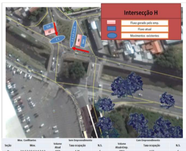
Imagem 08 - Interseção H: Av. Antônio F. Ozanam x Rua Osvaldo Cruz

As imagens a seguir indicam a localização dos pontos/terminais, próximos ao empreendimento. Foi verificada a existência de um ponto de parada do transporte coletivo, conforme identificação na imagem 10, situado a Avenida Ângelo Corradini e o terminal da Colônia conforme imagem 11.