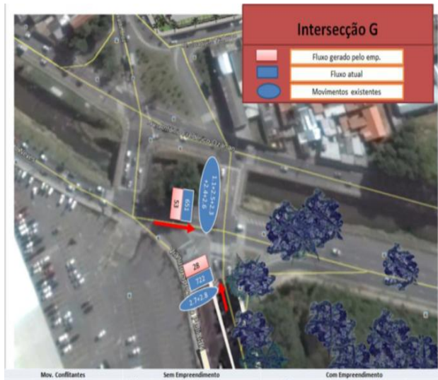
Imagem 09 - Interseção G: Av. Antônio F. Ozanam x Viaduto Sperandio Pelicciari