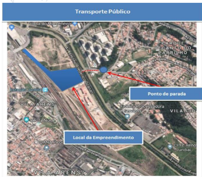
Imagem 10 - Localização do Ponto de Parada de Ônibus