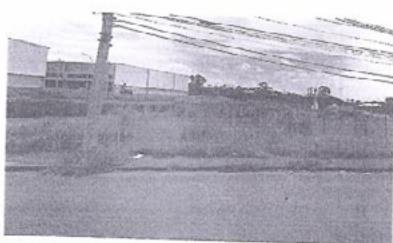
Vista do imóvel

(Cento e Oitenta e Dois Mil, Vinte e Três Reais e Vinte Centavos)