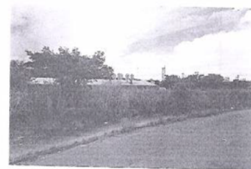
Vista do imóvel