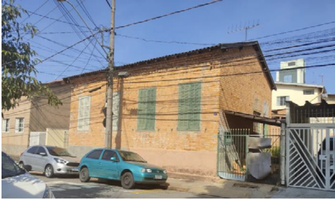
Foto do imóvel em 05.07.2021.