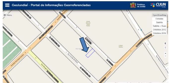
O imóvel está indicado pela seta azul – fonte: GEO JUNDIAÍ, acessado em 05.07.2021.

15.720/2008) com grau de proteção 21. Não é tombado e não está inserido em área envoltória de bem tombado, até o presente momento.