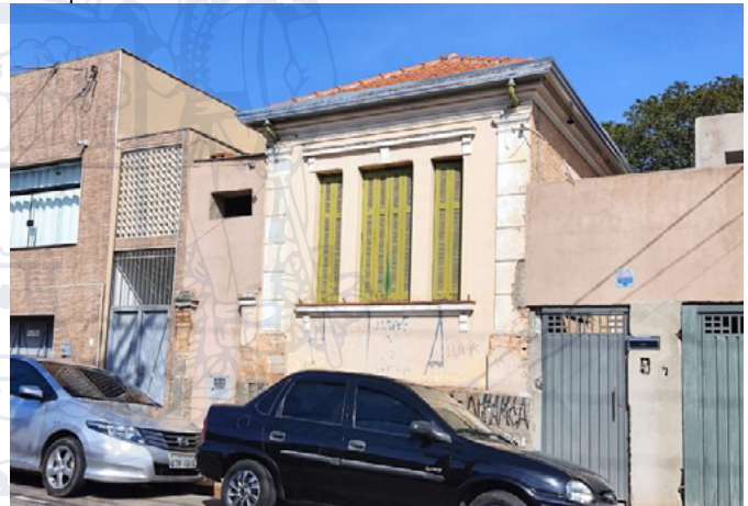
Foto do imóvel em 05.07.2021.