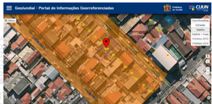
Consulta pelo endereço, R. França, 65