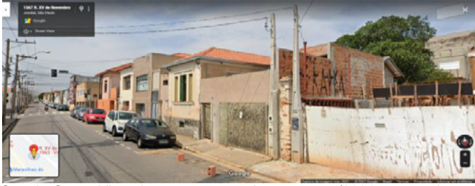
Google Street View, imagem capturada em março/2021, acessada em 06/07/2021.