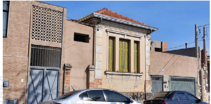
Foto do imóvel em 05.07.2021.

Consulta pelo endereço, R. XV de Novembro, 1563 – fonte: GEO JUNDIAÍ, acessado em 05.07.2021.