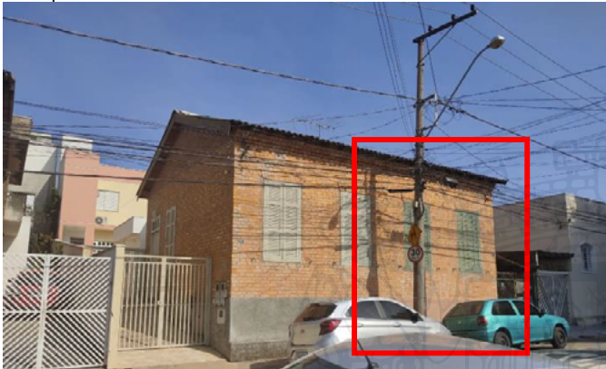
Foto do imóvel em 05.07.2021.