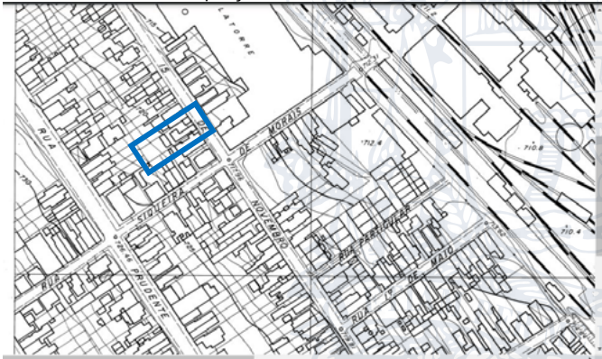
Carta disponível em https://geo.jundiai.sp.gov.br/aeropdf/1969_AERO_1000/1969_AERO_1000_013C.pdf Acessada em 06/07/2021

O projeto trata da regularização da residência conforme Lei n° 1.839/71, que considera o existente no levantamento aerofotogramétrico de 1970, e regularização de residência conforme Lei n° 9.321/19, com ampliação.