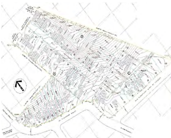
Imagem 2 – Imagem do Projeto Urbanístico do Loteamento Antenor Azzoni

Notifica com base no art. 31º §1º da Lei Federal nº 13.465/2017, de 17 de julho de 2017, e seu Decreto regulamentador nº 9.310/18, de 15 de março de 2018, os titulares de domínio e os confinantes, abaixo indicados, nos endereços indicados nas respectivas matrículas, a apresentarem impugnação dentro do prazo de 30 (trinta) dias contados da data de publicação do presente edital.