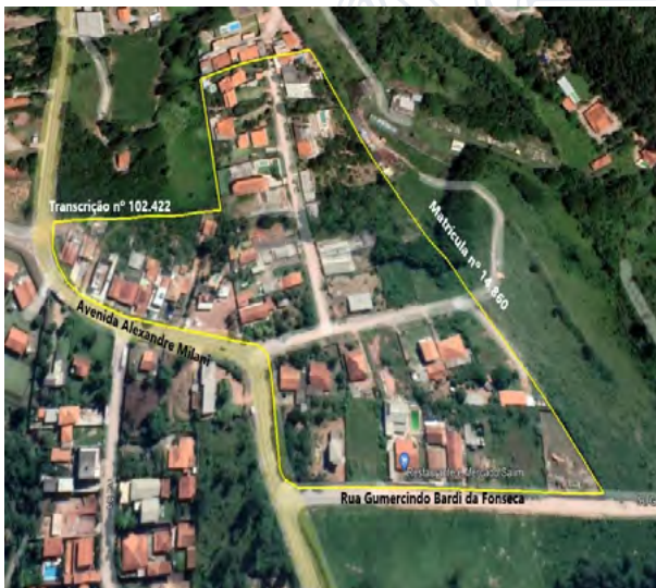
Imagem 1 – Imagem de Satélite do Loteamento Antenor Azzoni