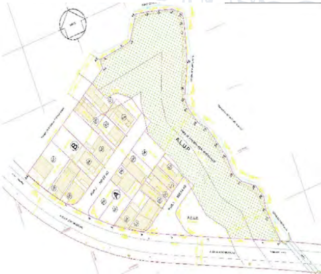
Imagem 2 – Imagem do Projeto Urbanístico do Loteamento Ponte Alta 1

Notifica com base no art. 31º §1º da Lei Federal nº 13.465/2017, de 17 de julho de 2017, e seu Decreto regulamentador nº 9.310/18, de 15 de março de 2018, os proprietários, abaixo indicados, a apresentarem impugnação dentro do prazo de 30 (trinta) dias contados da data de publicação do presente edital.