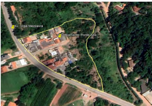
Imagem 1 – Imagem de Satélite do Loteamento Ponte Alta 1