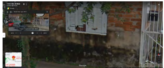
Detalhe/Foto: Google Street View, capturada em Janeiro de 2017