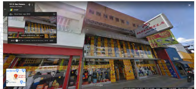
Foto dos imóveis voltados para a Rua Senador Fonseca. Imagem capturada em março de 2010

Foto dos imóveis situados à Rua do Rosário, 371 e 381.