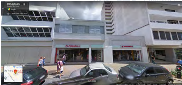
Foto dos imóveis situados à Rua do Rosário, 371 e 381. Imagem capturada em março de 2010

Conforme informação do Mapa 03 – Lei nº 9.321/2019, nenhum dos imóveis são tombados, mas todos estão na área envoltória do Museu Histórico e Cultural de Jundiaí, o Solar do Barão, bem tombado pelo Condephaat. Apenas os lotes com endereço Rua do Rosário 371 e 381 estão inseridos no Polígono de Proteção do Patrimônio Histórico (ZEIHC 2) - fonte: GEO JUNDIAÍ, acessado em 06.12.2021.