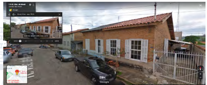
capturada em Março de 2010.

Consulta pelo endereço Rua Visconde de Mauá, nº 116 – fonte: GEO JUNDIAÍ, acessado em 28.09.2021.