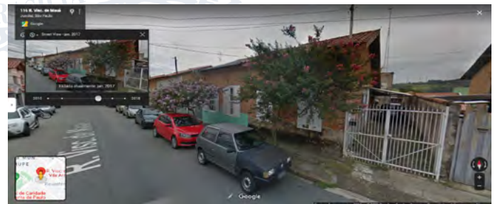
capturada em Janeiro de 2017