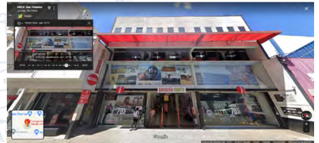
Foto dos imóveis voltados para a Rua Senador Fonseca. Imagem capturada em janeiro de 2019

Foto dos imóveis voltados para a Rua Senador Fonseca. Imagem capturada em março de 2010