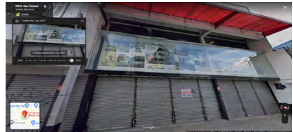
Foto dos imóveis voltados para a Rua Senador Fonseca. Imagem capturada em junho de 2021

Foto dos imóveis voltados para a Rua Senador Fonseca. Imagem capturada em janeiro de 2019