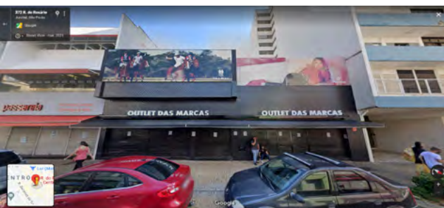
Foto dos imóveis situados à Rua do Rosário, 371 e 381. Imagem capturada em março de 2021

Foto dos imóveis situados à Rua do Rosário, 371 e 381. Imagem capturada em julho de 2019