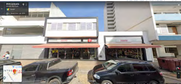
Foto dos imóveis situados à Rua do Rosário, 371 e 381. Imagem capturada em julho de 2019

Foto dos imóveis situados à Rua do Rosário, 371 e 381. Imagem capturada em março de 2010