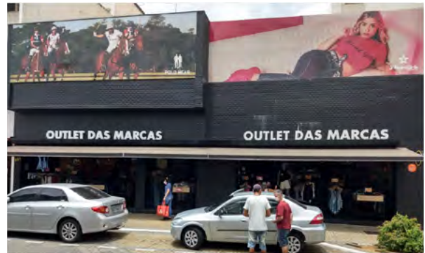
Foto dos imóveis situados à Rua do Rosário, 371 e 381.

Foto dos imóveis situados à Rua do Rosário, 371 e 381. Imagem capturada em março de 2021 – fonte: Google Street View, acessado em 06.12.2021.