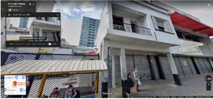
Foto dos imóveis voltados para a Rua Senador Fonseca. Imagem capturada em junho de 2021 – fonte: Google Street View, acessado em 06.12.2021.

Foto dos imóveis voltados para a Rua Senador Fonseca. Imagem capturada em março de 2010 – fonte: Google Street View, acessado em 06.12.2021.