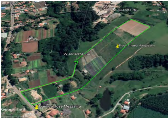
Imagem 1 – Imagem de Satélite da área do parcelamento de solo em nome do sr. Aristeu Antonio Marquesim e outros.