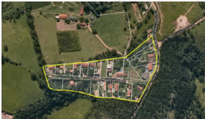
Imagem 1 – Imagem de Satélite do Lot. São Judas Tadeu