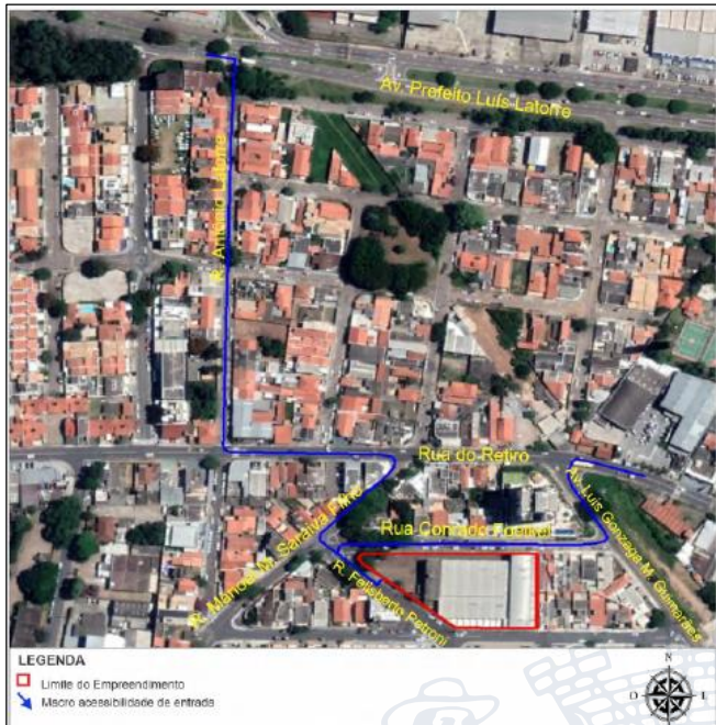
Imagem 2 – Rotas de chegadas