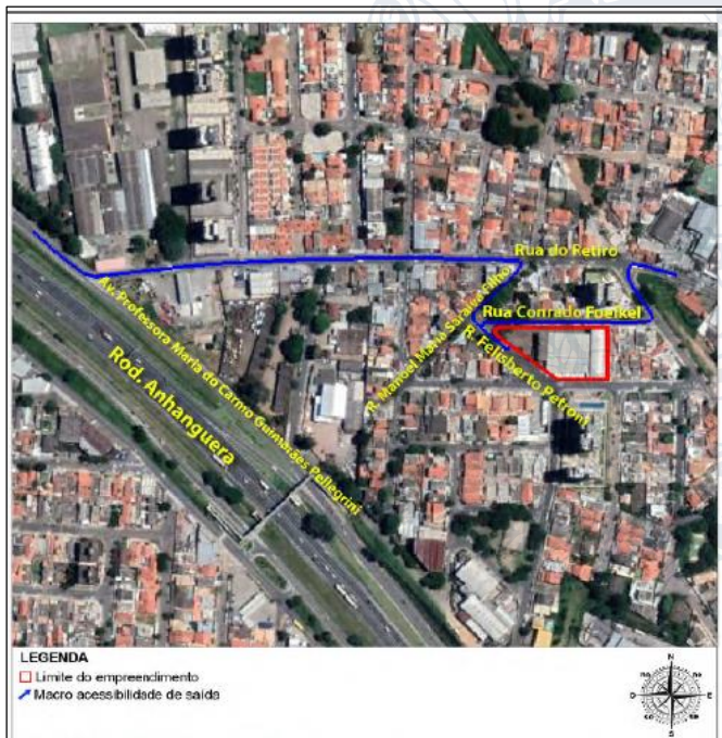
Imagem 3 – Rotas de saídas

Conforme relato do autor, os valores previstos para população fixa e flutuante para o novo estabelecimento e área destinada para estacionamento e espaço de embarque e desembarque serão suficientes para que não ocorram interferências significativas para a vizinhança.