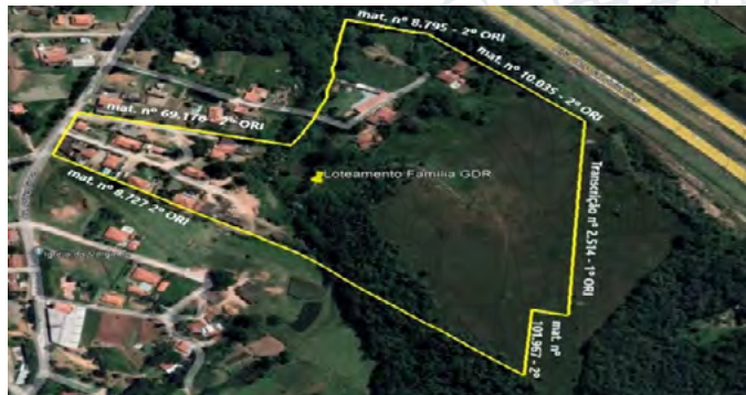
Imagem 1 – Imagem de Satélite do Loteamento “Condomínio Família GDR”