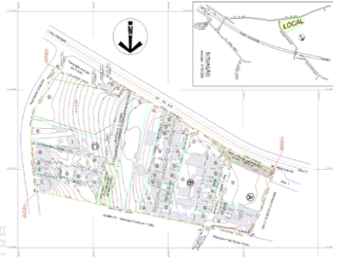
Imagem 2 – Imagem do Projeto Urbanístico do Loteamento “Residencial Núcleo Residencial Água Doce – fase I”

Notifica com base no art. 31º, §1º da Lei Federal nº 13.465/2017, de 17 de julho de 2017, e seu Decreto regulamentador nº 9.310/18, de 15 de março de 2018 e em atendimento ao Art. 26, inciso III, § 2º da Lei 9.807/2022 de 16 de agosto de 2022, os proprietários, abaixo indicados, a apresentarem impugnação dentro do prazo de 30 (trinta) dias contados da data de publicação do presente edital na Imprensa Oficial do Município.