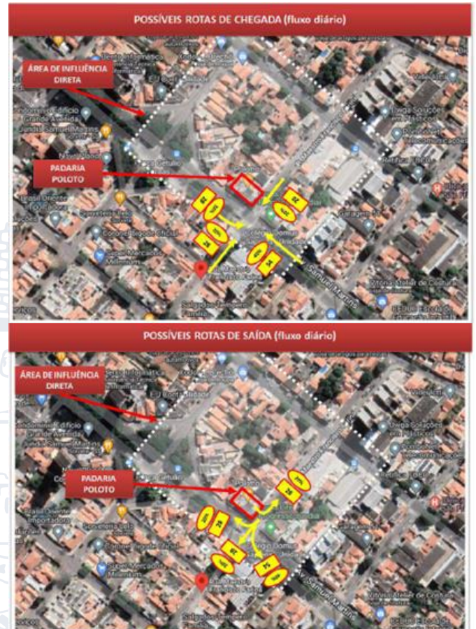
Imagem 6: Distribuição espacial das rotas de chegada

De posse dos resultados referentes à geração/atração de viagens, o autor estimou as rotas de chegada e saída de modo linear e proporcional, não levando em consideração a movimentação de veículos do viário do entorno, como demonstrado nas imagens a seguir.