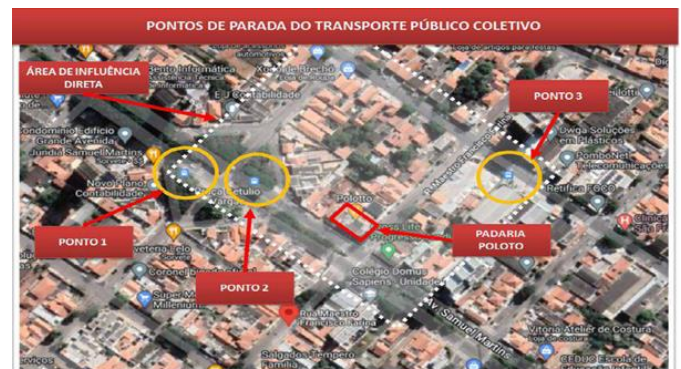
Imagem 7: PPO's

Ainda, conforme observado pelo autor, os pontos de parada 1 e 2 dispõem de assento e abrigo, passeio e sinalização em bom estado de conservação. O ponto 3 não possuía abrigo ou assentos e o passeio e a sinalização necessitavam de manutenção simples.