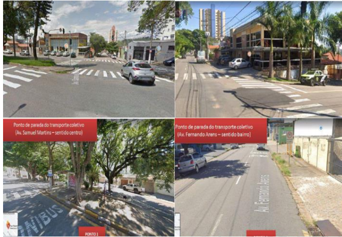
Imagem 8: micro acessibilidade

O autor menciona que a sinalização vertical e horizontal é bem definida, entretanto pode haver a necessidade de melhorias futuras, como repinturas de faixas de pedestres.