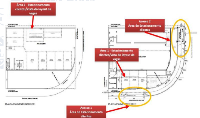
Imagem 2: Acessos

Vale ressaltar que a responsabilidade técnica pelo projeto envolve a observância das Normas e Legislação acerca da acessibilidade geral da edificação.