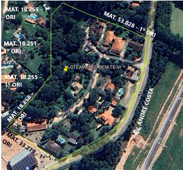
Imagem 1 – Imagem de Satélite do Loteamento “Bem-te-Vi”.