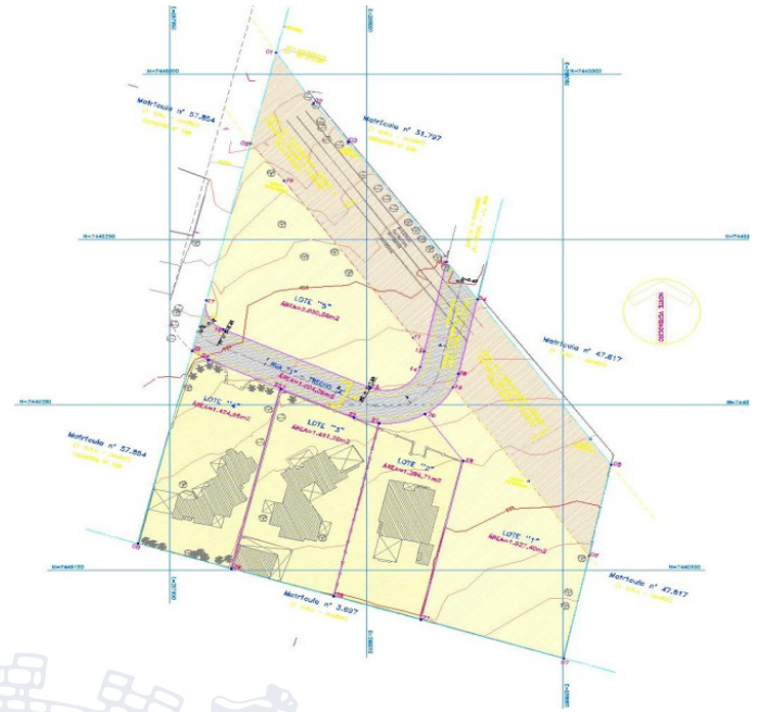
Imagem 3 – Imagem do Projeto Urbanístico do Loteamento "Treviso II".

Notificação com base no art. 31º, §1º da Lei Federal nº 13.465/2017, de 17 de julho de 2017, e seu Decreto regulamentador nº 9.310/18, de 15 de março de 2018 e em atendimento ao Art. 26, inciso III, § 2º da Lei 9.807/2022 de 16 de agosto de 2022, os proprietários, abaixo indicados, a apresentarem impugnação dentro do prazo de 30 (trinta) dias contados da data de publicação do presente edital na Imprensa Oficial do Município, em jornal de circulação do Município e/ou recebimento via AR (Anotação de Recebimento) do mesmo.