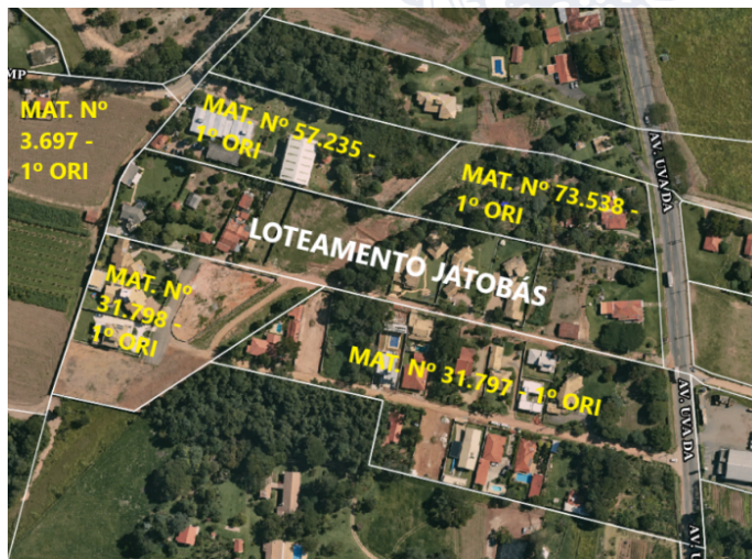
imagem 1 – Imagem de Satélite do Loteamento “Jatobás”.