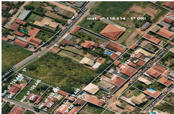
Imagem 1 – Imagem de Satélite do Desmembramento nome de Antonia Fontebasso dos Santos e outros